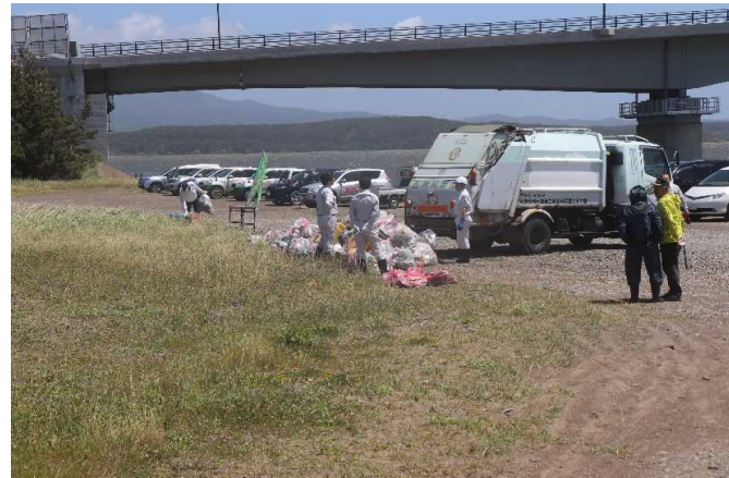
ゴミ集積と収集車