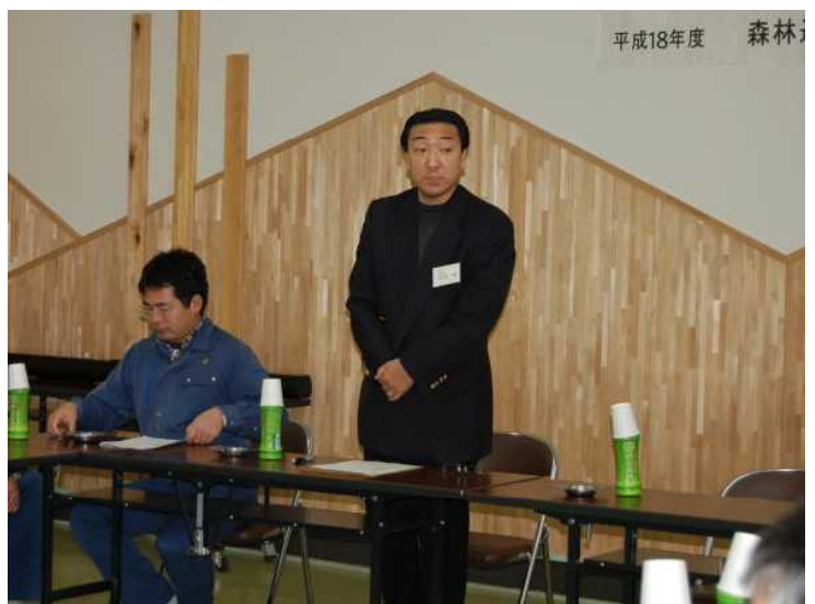
打合せ会で挨拶される成田会長