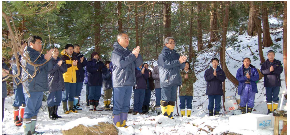
安全を祈願し礼拝

山の神の12日はいつも荒れた天気となりますが、今年は風が無く時折日が差すというこれまでの記憶にないような穏やかな日で、支署長以下職員は、管内の十二本ヤスの祠に神酒をお供えし改めて無事故を感謝すると共に、今後の無災害を祈願しました。