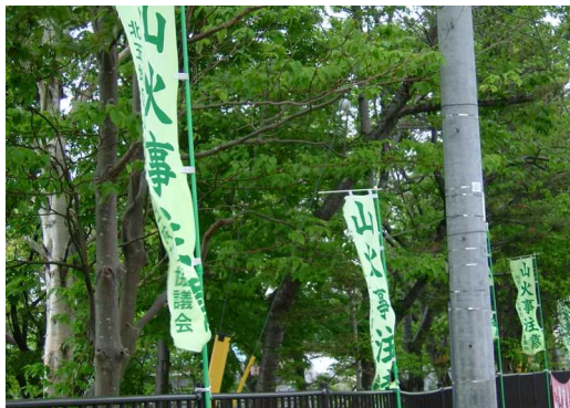
庁舎フェンスに「のぼり」

主要な林道起点への横断幕やのぼりの設置、車両にはステッカーの添付を行うなどして、一般通行、入山者に山火事防止の啓発を行うとともに協力を呼び掛けました。また、万一の発生には消防関係機関との連携を図るため、事務室が不在となる休日は、職員が交代で出勤・待機してきました。さらに、森林巡視員の会、地元部分林組合等にも積極的に巡視活動を実施して頂きました。入山者個々に丁寧なお願いをするというもので、こうしたボランティア活動は説得力があり、対策として大きな成果があったものと考えています。