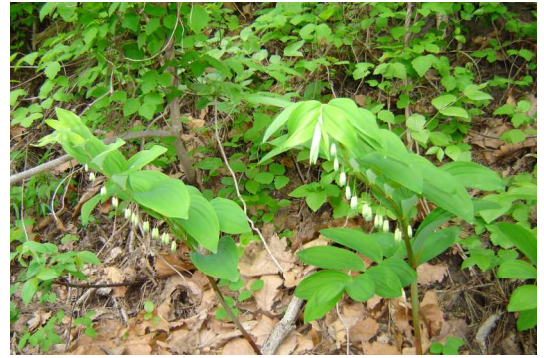
アマドコロ(屏風山国有林)

以降当面のスケジュールは、年末の局における計画書案作成まで、署に対する細部事項の確認等と並行して図面、簿冊について検討が加えられることになっています。