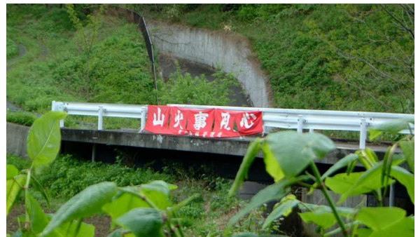
橋梁の欄干に「横断幕」