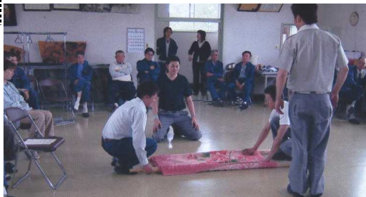
消防署による救急法の実技指導