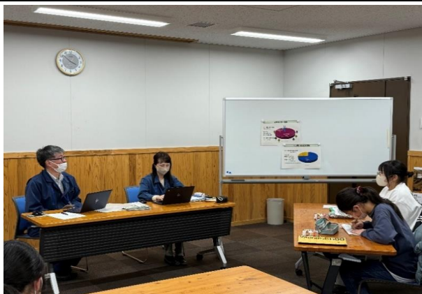
森を管理するときに気を付けていることは？(6年生)

最後に森林の働きのひとつである山崩れ・土砂崩れを防止することについては、3年連続して豪雨被害があった上小阿仁村の被害を目の当たりにしているだけにそれぞれ真剣なまなざしで聞き入っていました。