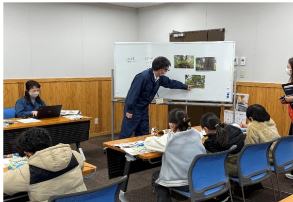
スギの種類について学習(3年生)