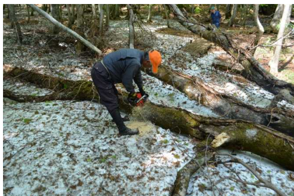
藤里町役場職員にも倒木の撤去に協力して頂きました。