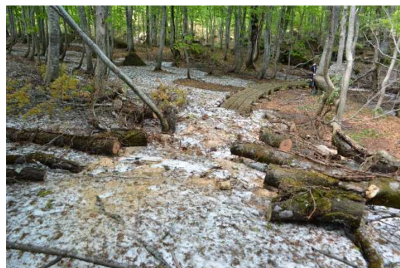
倒木撤去後の散策路