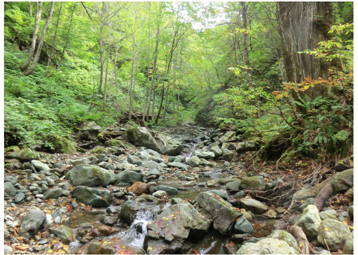
カロフ沢約1.4km地点より上流