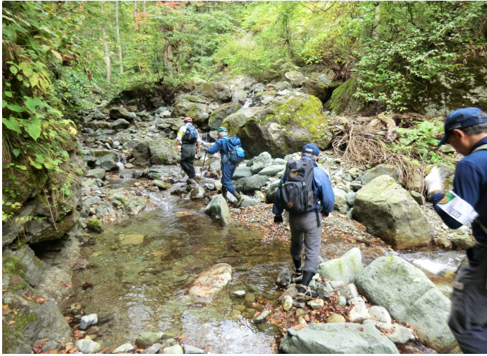
カロフ沢上流に向け出発

こちらも巡視した結果、立木の損傷、植物の盗掘、ゴミの投棄などの悪質な行為は見つかりませんでした。