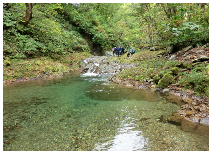
カロフ沢分岐より約1.5km地点