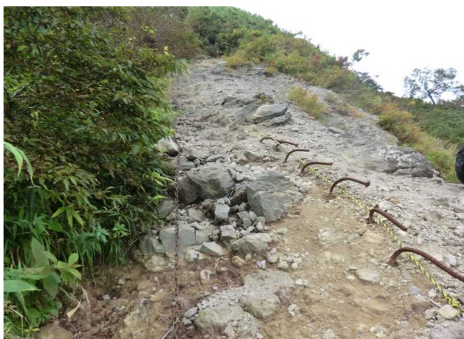
藤里駒ヶ岳(樺岱ルート)鎖場

白神山地はこれから紅葉シーズンを迎えますが、登山される方は防寒対策とクマ対策をきちんとして、安全に快適な登山を楽しんでください。