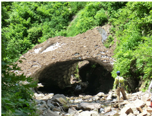
三蓋沢上流の残雪