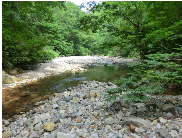
三蓋沢合流地点付近