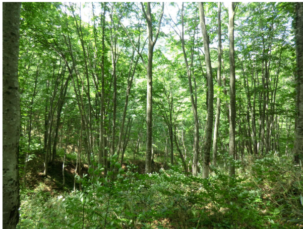
核心地域のブナ林

昼食後、三蓋沢を上り入山の形跡が無いか確認しましたが、野営等行った形跡は確認できませんでした。