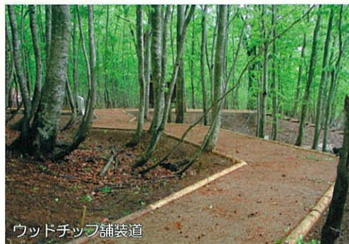
ウッドチップ舗装道