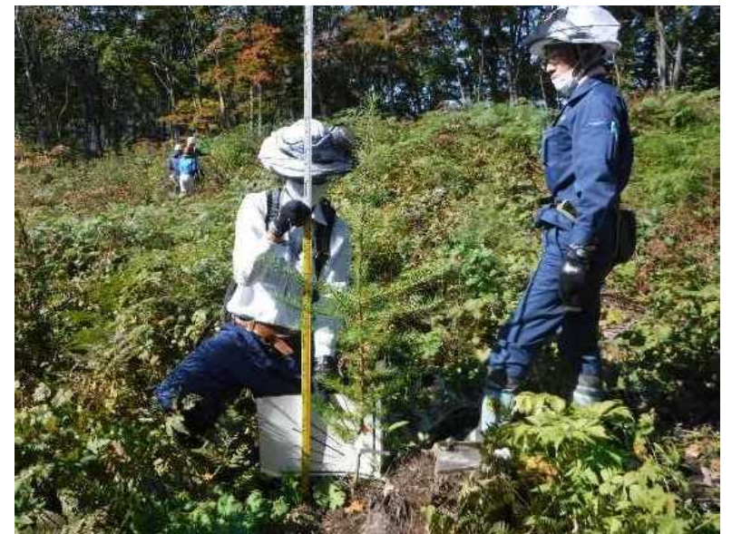
写真 (上) : 育苗中 (下) : 1 成長期後