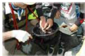
朝日川（イワナをゲット）