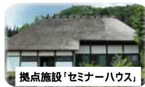
拠点施設「セミナーハウス」