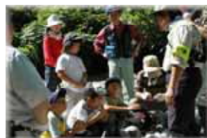
朝日川（イワナの生態）