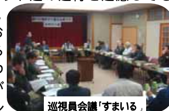
巡視員会議「すまいる」

また、巡視結果報告として出された、「マナー問題」、「歩道整備」、「保全管理」に関する事項についても活発な意見・情報交換を行い、合意できた部分については、今後の巡視活動へ反映させていくことや、原種イワナの生息環境など、溪流（川）についても森林生態系として一緒に考えていかなければならないとの認識で一致しました。