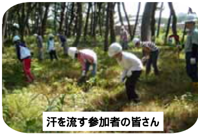
汗を流す参加者の皆さん

8月26日(土)に、酒田市浜中地区に所在する国有林で、浜中小学校6年生と父兄、教職員、浜中自治会、浜中