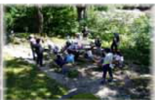
大鳥池伝説を聞く