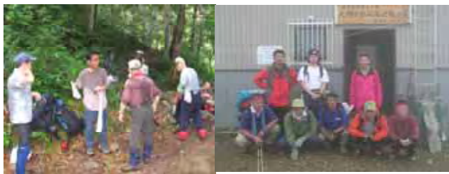
(大鳥池コース:マナーガイド配布) (古寺コース:避難小屋前で集合写真)