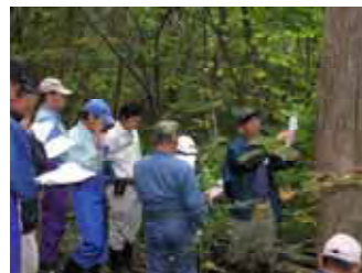
(林田助教授からの説明)