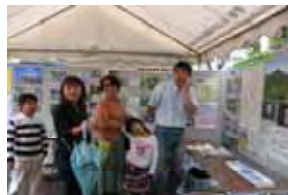
(家族そろって見学)