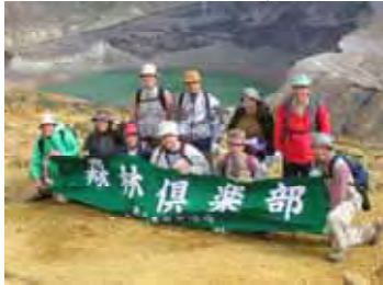
(お釜をバックに記念撮影)

刈田岳駐車場で開会式を行い、トレッキング開始、お釜を眺めながら熊野岳を目指し、熊野岳山頂から地蔵岳を経てザンゲ坂を下り昼食。午後からは蔵王中央高原を散策し、中央ロープウェイで蔵王温泉に下り、温泉浴で疲れを癒し、全員無事に帰路につきました。