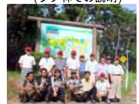
(万里の松原で記念撮影)