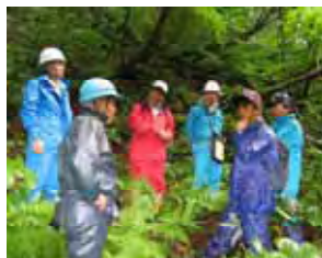
(森林植生追加予定箇所踏査)