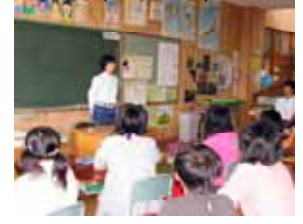
(小学生と意見交換)