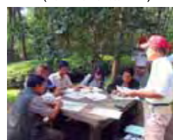
(三沢会長からの説明)