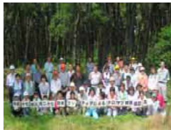
(参加者全員で記念撮影)