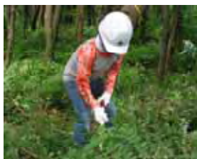
(浜中小刈払い作業)

なお、今回の活動が浜中地域での最初のボランティアによる森林整備活動で、来年度以降についても継続していきたいと考えています。