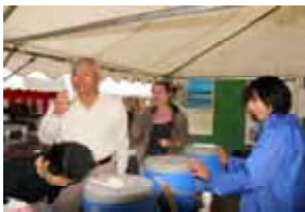
(山の銘水に外国人も感激)

山の銘水は、大朝日岳の金玉水と銀玉水、以東岳の碧玉水、鳥海山麓の胴腹の清水をセンター職員と巡視員が協力して取水(各 26 リットル)したもので、両方のイベントでおよそ 800 人が試飲しました。