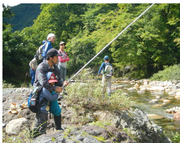
親子で力をあわせて釣りに集中！（イワナ釣り）

今後も、より多くの方々に朝日森林生態系保護地域及びその周辺地域において、小中学生の親子及び関心を持つ一般者等を対象に、貴重な自然や森林の恩恵、自然の働きを体感し、自然とのつきあい方を学ぶ体験型森林環境教育を実施していきます。