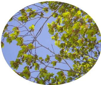
新緑のブナの雄花