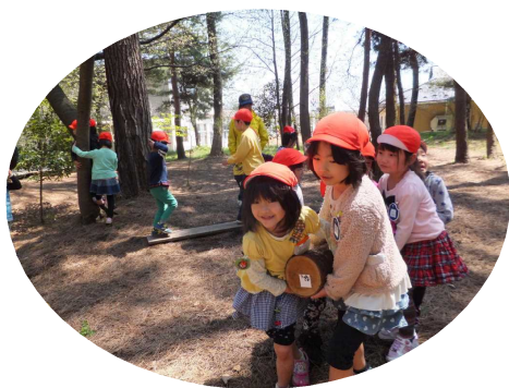
駒打ち済みのホダ木をみんなで運びました

酒田市の西荒瀬保育園は、保育園に隣接するクロマツ林を庄内森林管理署と「遊々の森（愛称：しんちゃんの森）」の協定を締結し、しんちゃんの森をフィールドに、山形県みどり環境税を活用した「みどりの保育園」推進事業に取り組んでおり、当センターも事業開始当初から協力して森林環境教育を行っています。