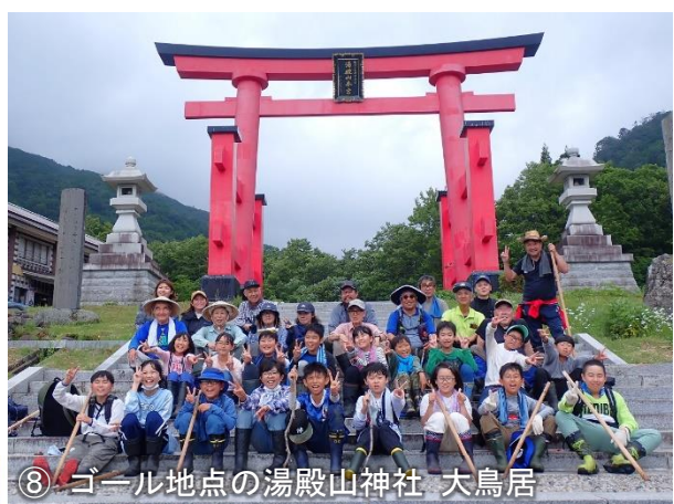
⑧ ゴール地点の湯殿山神社 大鳥居