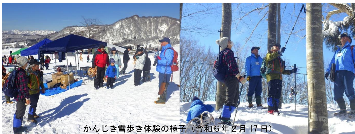
かんじき雪歩き体験の様子（令和6年2月17日）