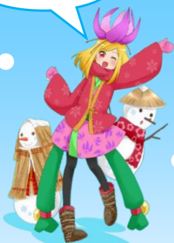
あさひむら観光協会 イメージキャラクター「カタクリ姫」