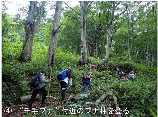
④ “千手ブナ” 付近のブナ林を登る