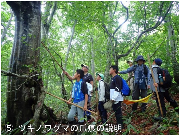
⑤ ツキノワグマの爪痕の説明