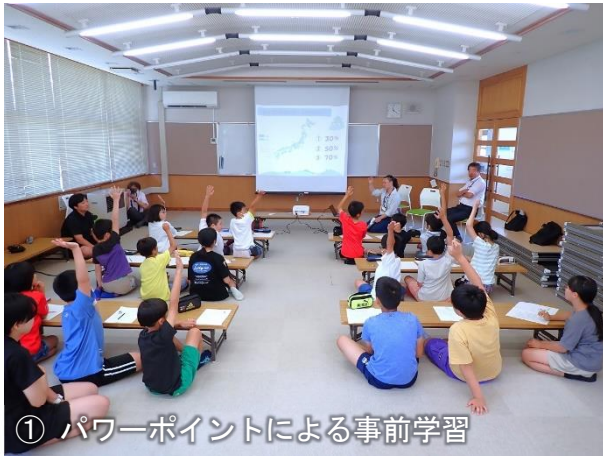
① パワーポイントによる事前学習