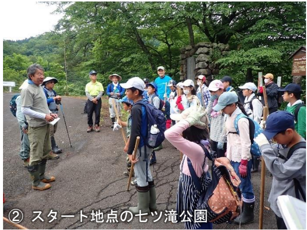
② スタート地点の七ツ滝公園