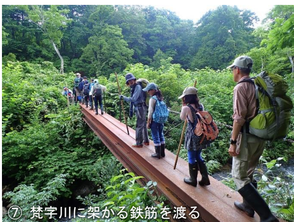
⑦ 梵字川に架かる鉄筋を渡る