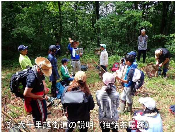
③ 六十里越街道の説明（独鈷茶屋跡）