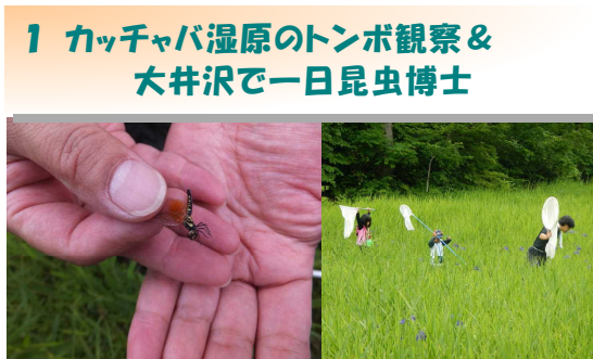
ハッチョウトンボ カッチャバ湿原