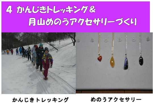
かんじきトレッキング めのおうアクセサリ