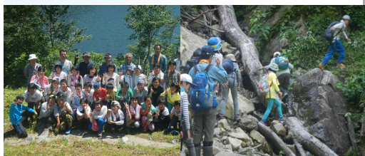
大鳥池をバックに 注意しながら歩こう