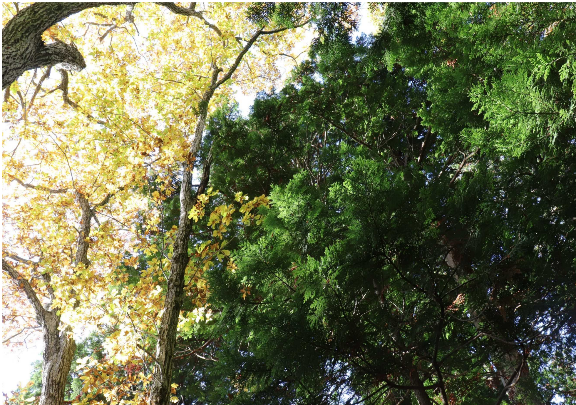
ヒバと紅葉（青森市・眺望山）