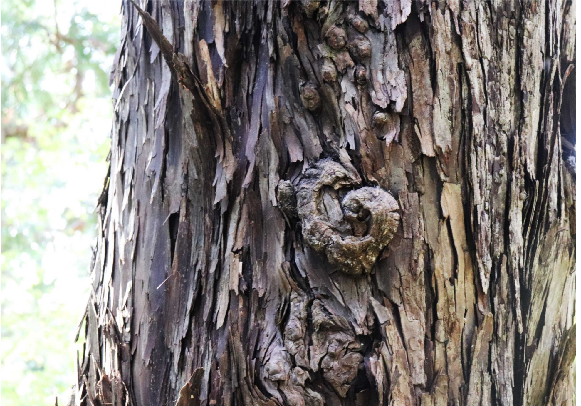
ヒバの樹皮 (青森市・眺望山)