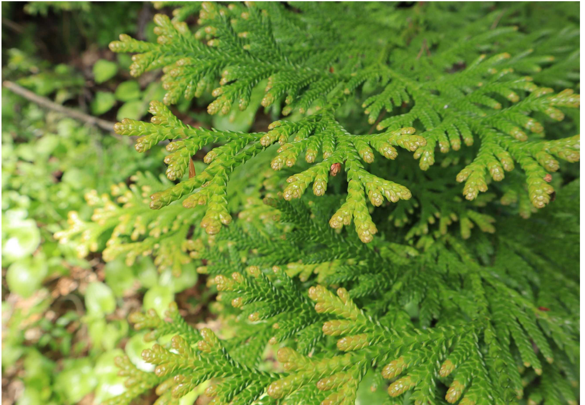
ヒバの葉っぱ (青森市・眺望山)