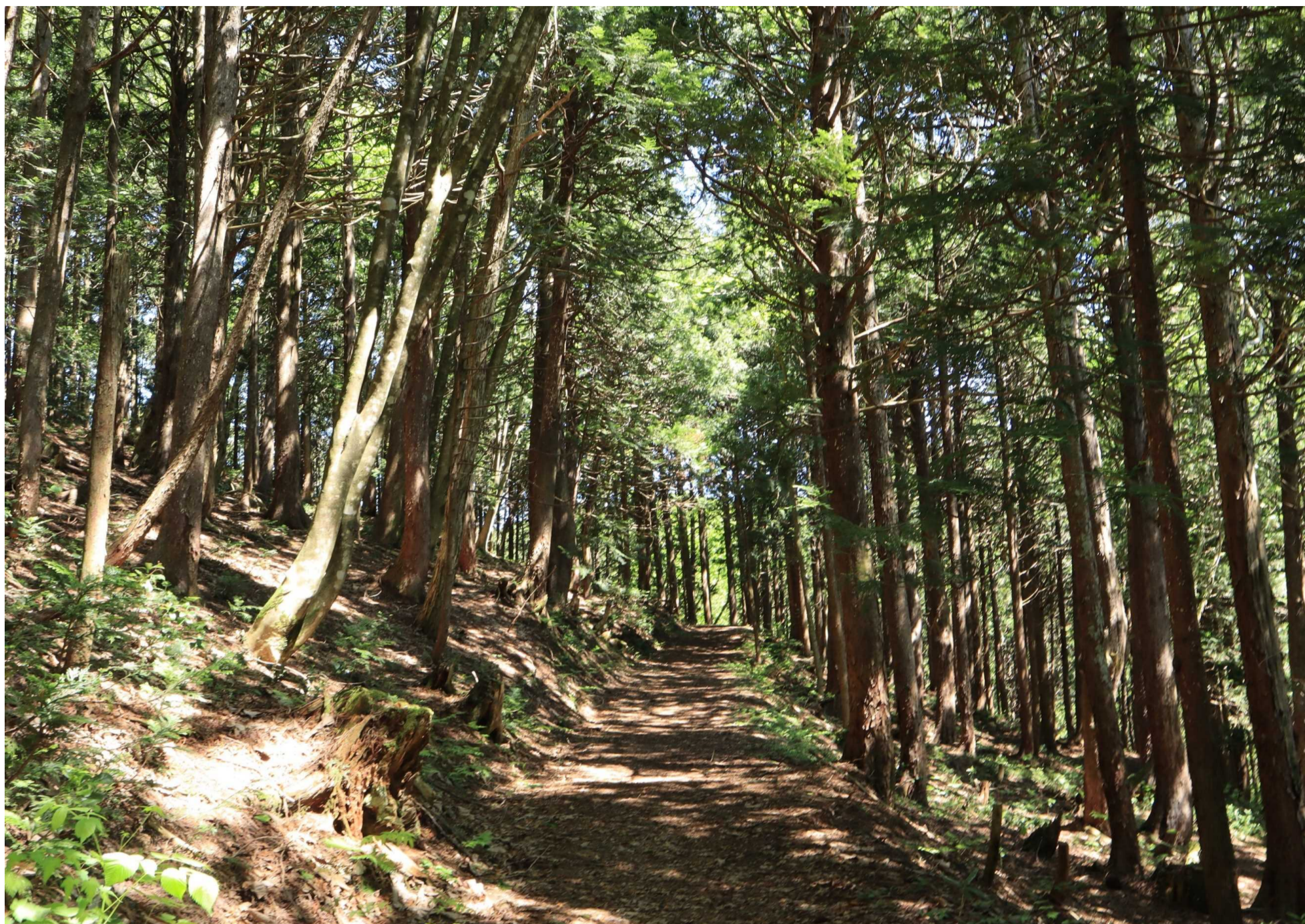
ヒバロード (青森市・眺望山)