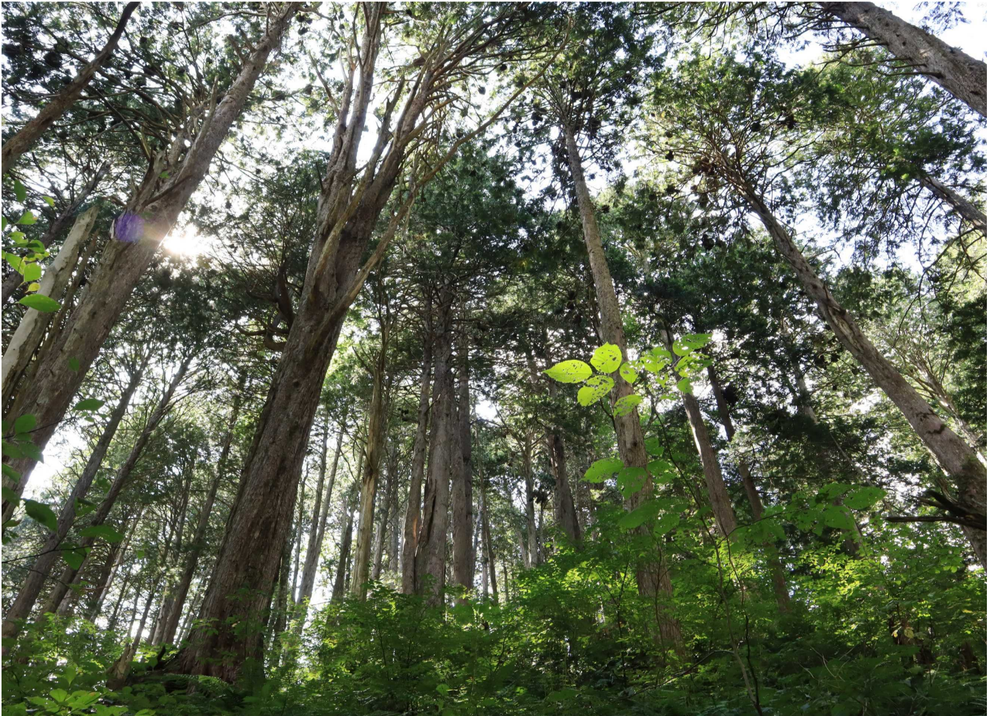
眺望山ヒバ希少個体群保護林