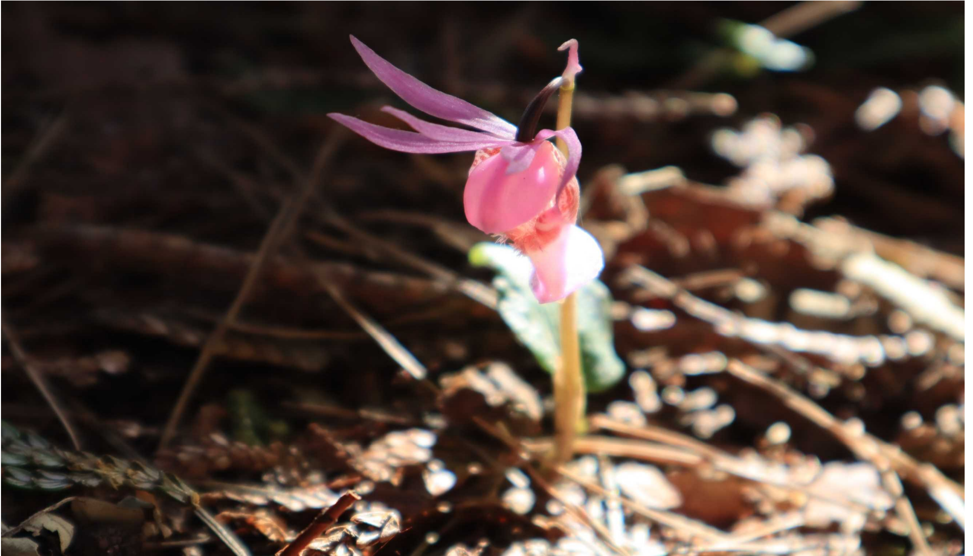
ヒバ林の林床に咲くヒメホテイラン（青森市）