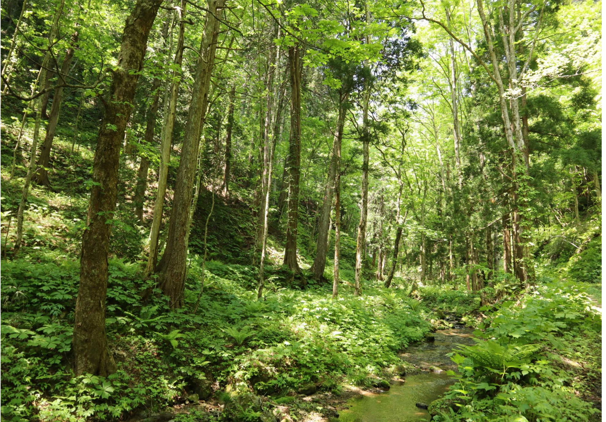
増川ヒバ施業実験林（外ヶ浜町三厩）