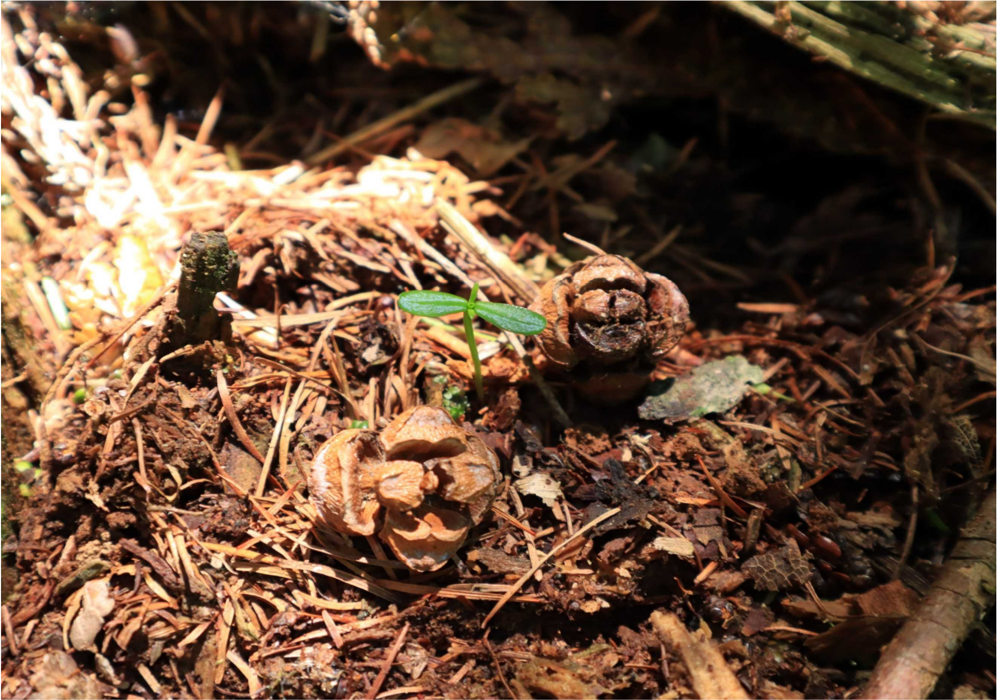
ヒバの子葉と球果 (蓬田村)