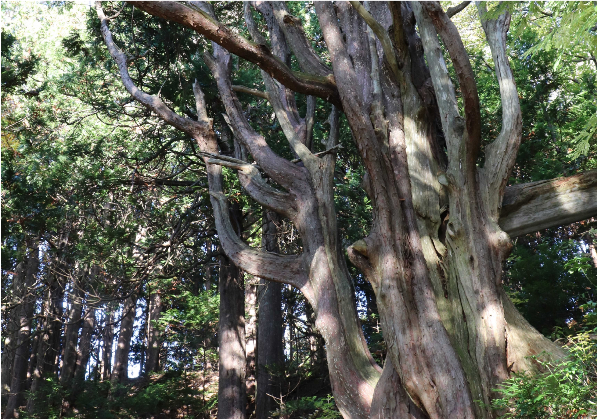
オドリヒバ (青森市・眺望山)