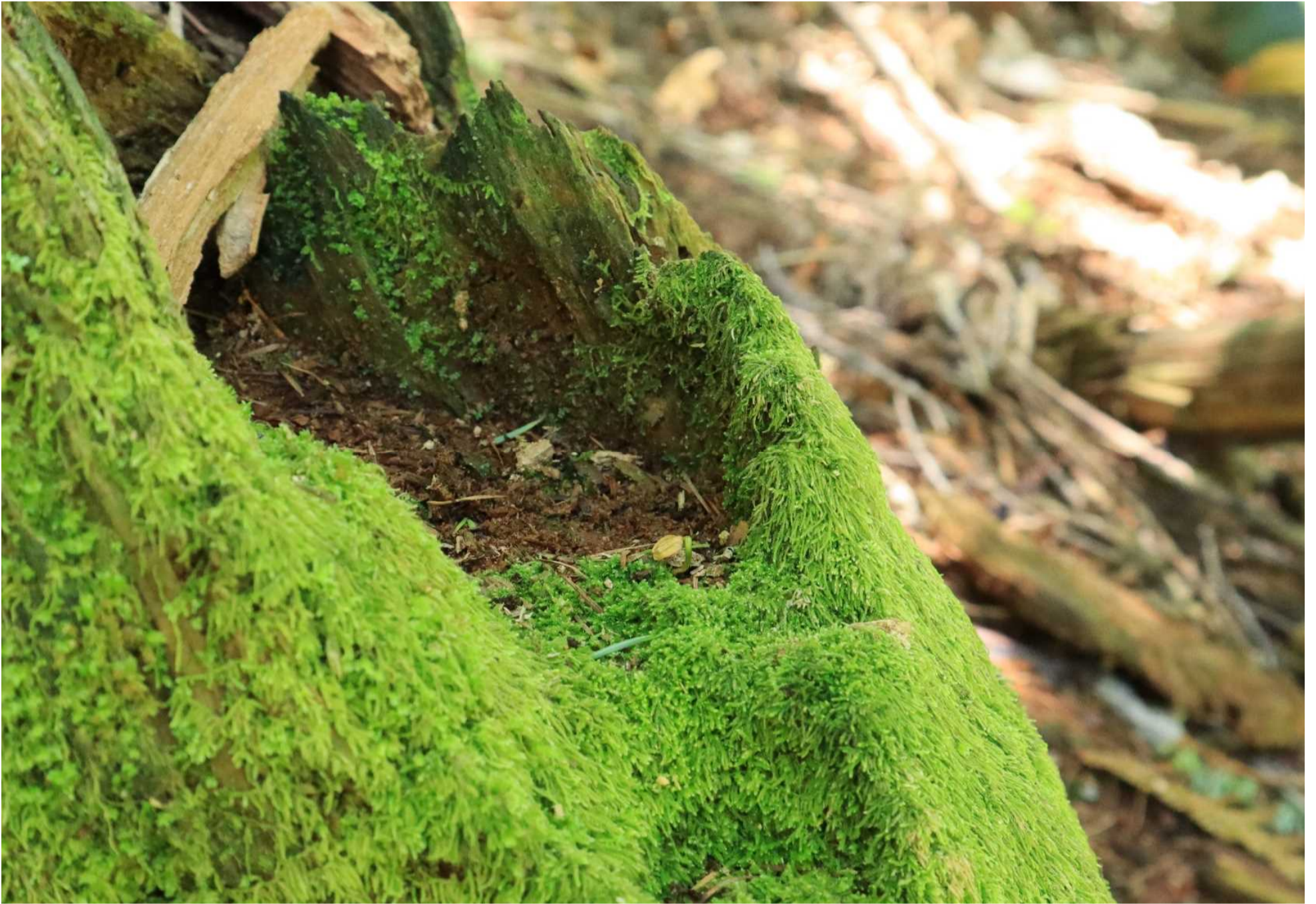
ヒバの実生 (蓬田村)