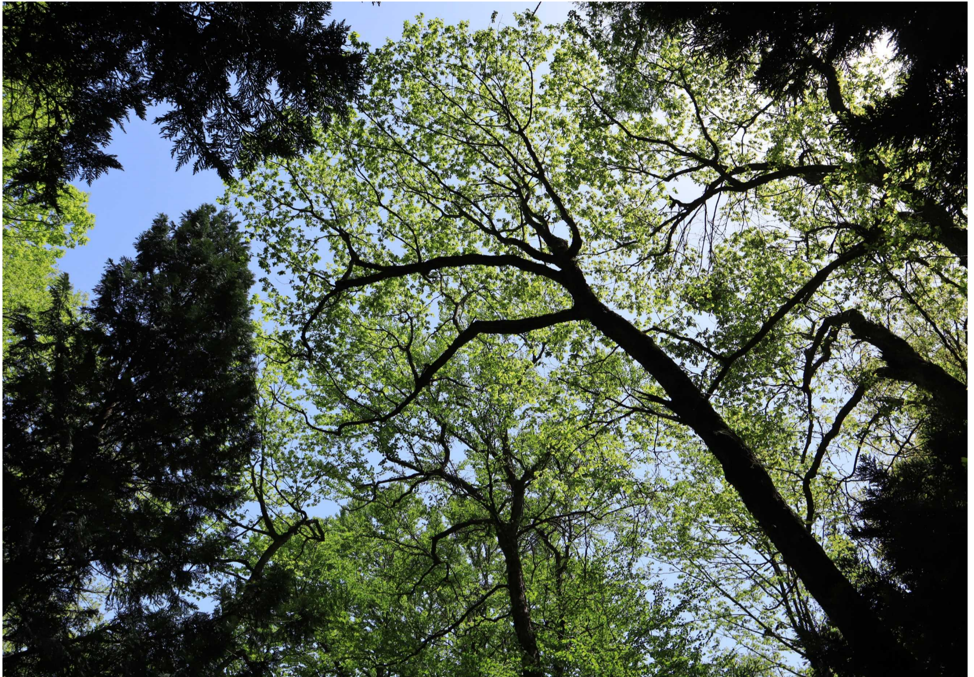
ヒバと広葉樹の傘（青森市）