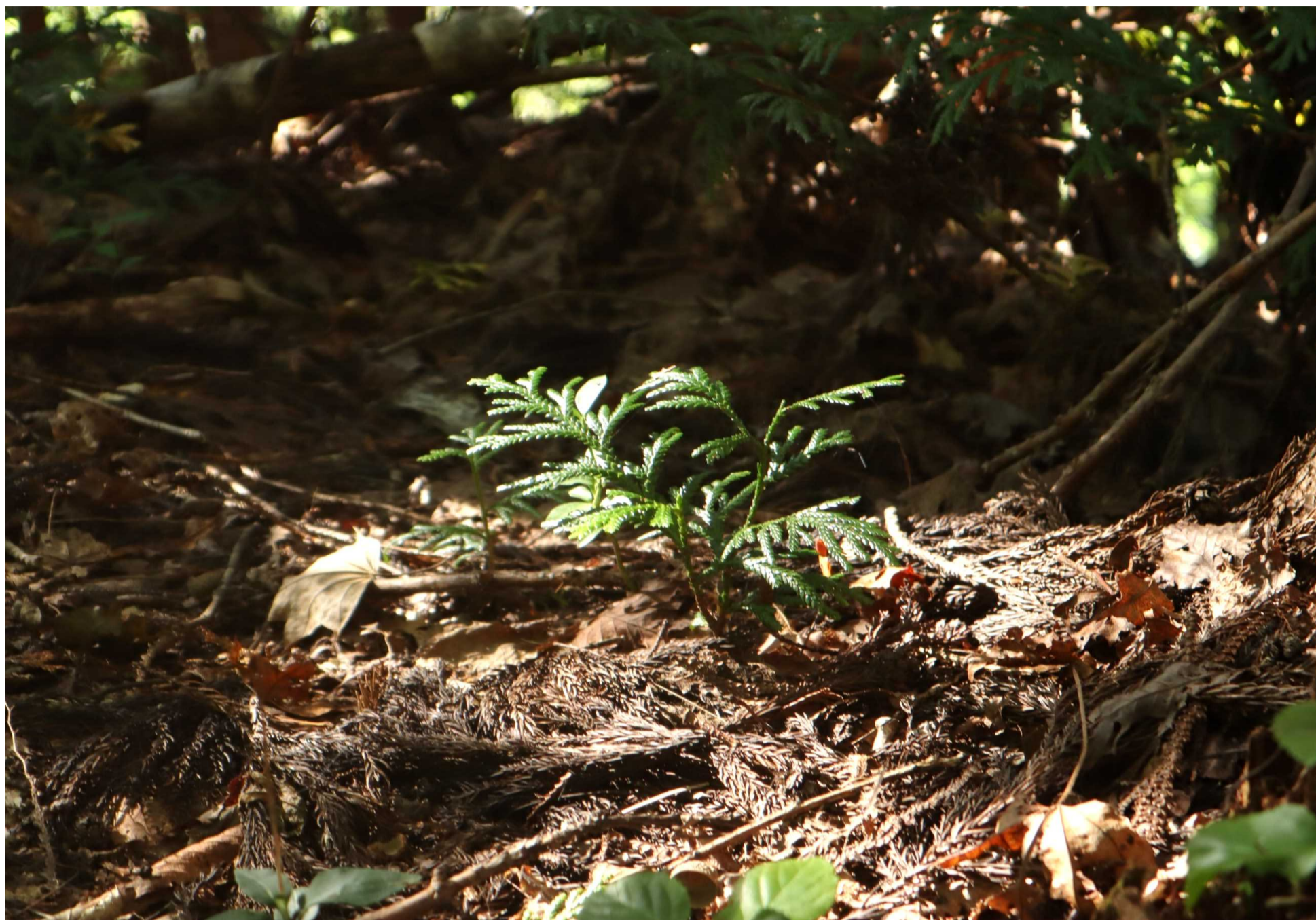
ヒバの幼樹 (青森市・眺望山)