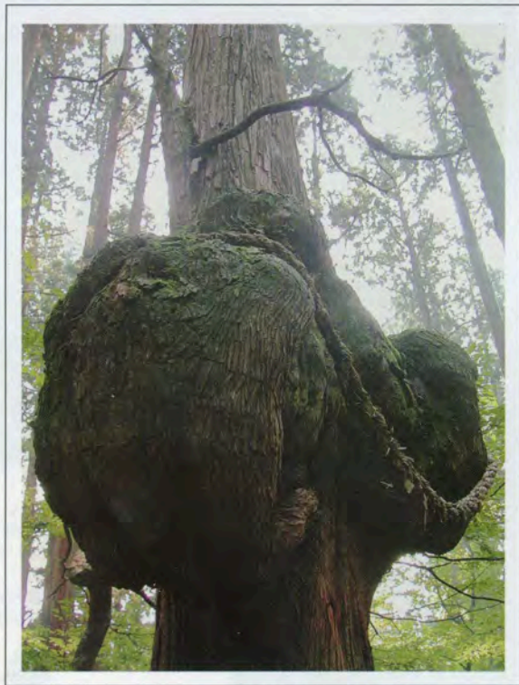
森の巨人たち百選 「コブ杉」