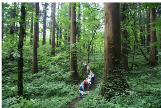
美しい天然秋田杉林内を散策

ここにも林野庁が選定した森の巨人たち100選がありました。「コブ杉」ですこのコブ杉は、回りの優美な杉とは別にこの1本だけ大人の背丈ほどのところがコブ状に盛り上がって独特な風貌を呈しており、地元では古くから「御神木」として崇められています。今度は参加者から「何これ!」「不思議だ!」などの声が上がりました。