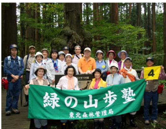
コブ杉をバックに記念写真。