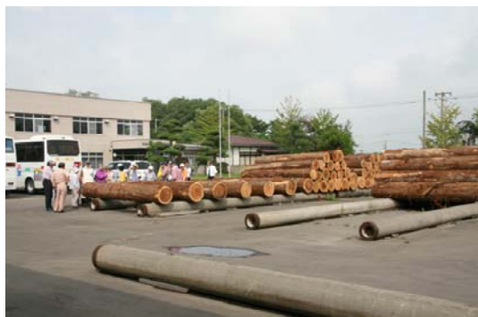
銘木センターに並べられた人工林スギ丸太(国有林材)。

午後からは、まず丸太の流通拠点である「協同組合秋田県銘木センター」を見学、天然秋田杉ならではの柱や板の建築材、他にもテーブル、衝立などの家具も展示されており、参加者からは「すごい立派な柱だ!」「ここにあるような木で家を見てみたい」など展示物に見入っていました。