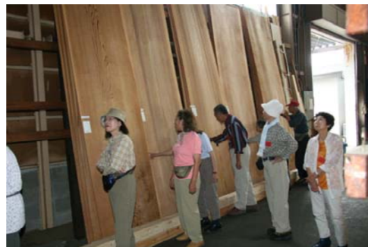
天然秋田杉製品を見学。