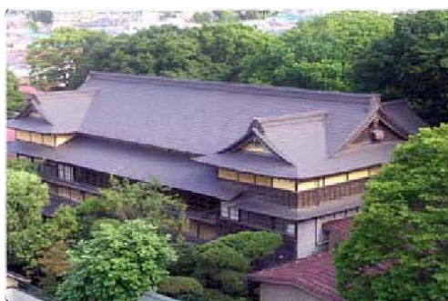
旧金勇全景(現在は能代市の財産として管理)

参加者からは、「名前は聞いたことがあり一度見たかった」「素晴らしい建物だ」など天井や柱など、管理人の説明を聞くたびにどよめきが上がっていました。