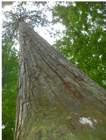
日本一の杉「きみまち杉」へ到着、下から見上げる姿は大迫力です

高さが58mもある日本一の杉「きみまち杉」へ到着、各班毎に記念写真を撮りました、参加者からは「すごい!」「素晴らしい!」などの声。