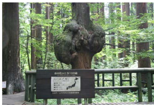
村のシンボルでもあり、学術的にも貴重なコブ杉