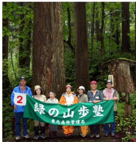
きみまち杉をバックに記念写真