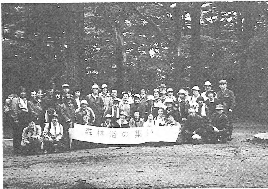
写-18 森林(樹)のめぐみに感謝した参加者