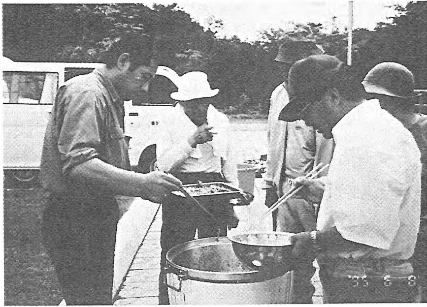
写-13 山菜の天ぷらを作る職員