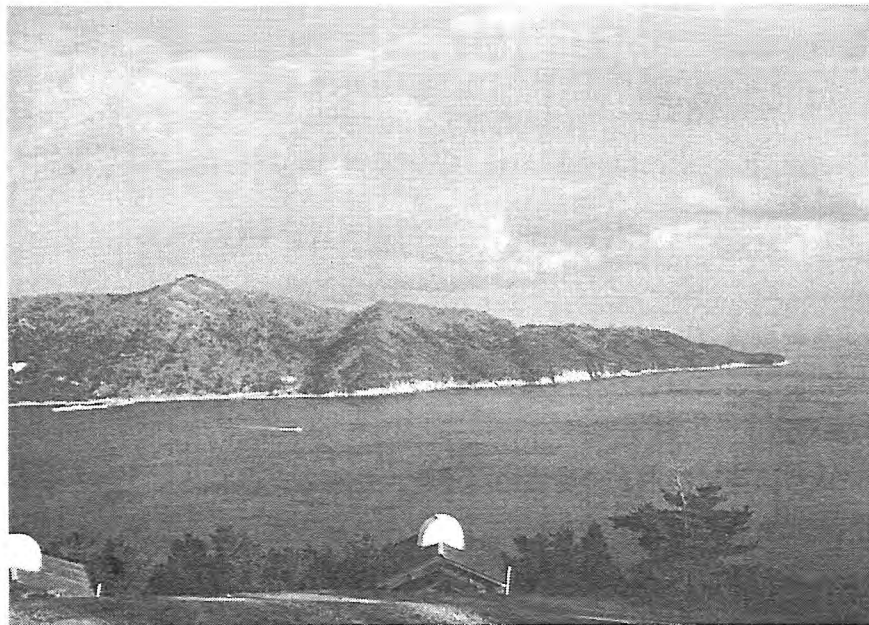
写-2 牡鹿半島から金華山島を臨む