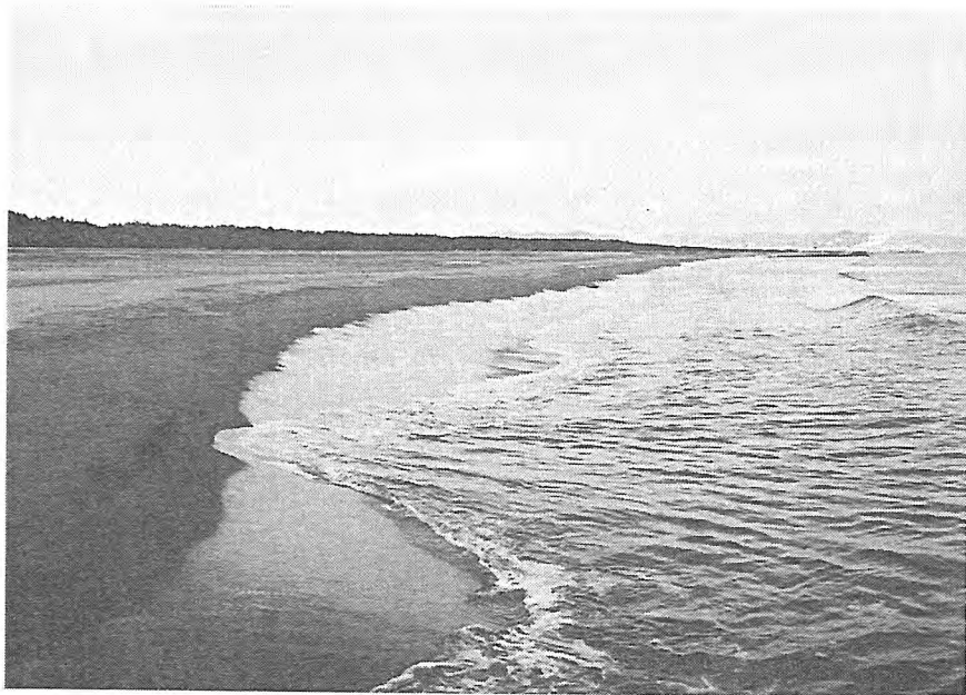
写-4 雄大な白砂青松