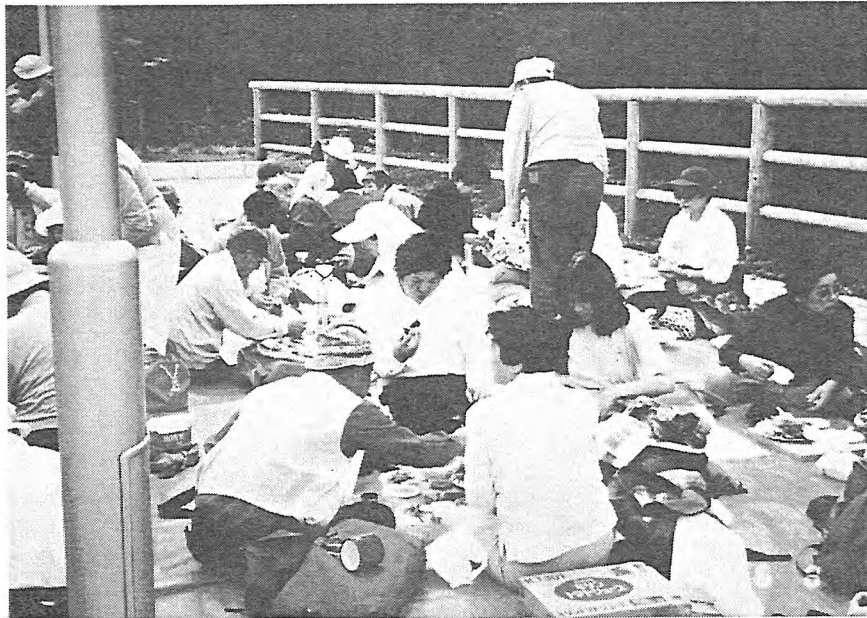
写-14 山菜の天ぷら料理に参加者は大喜び