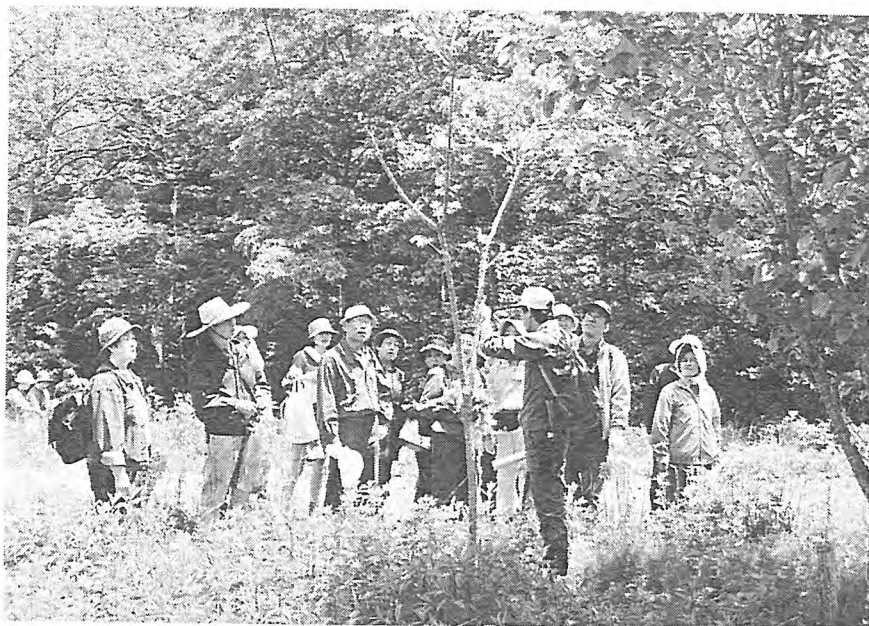
写-11 案内に熱心に聞く参加者