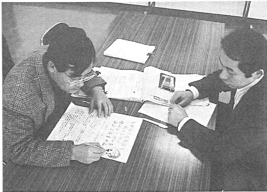
写-6 参加者募集のチラシ作り