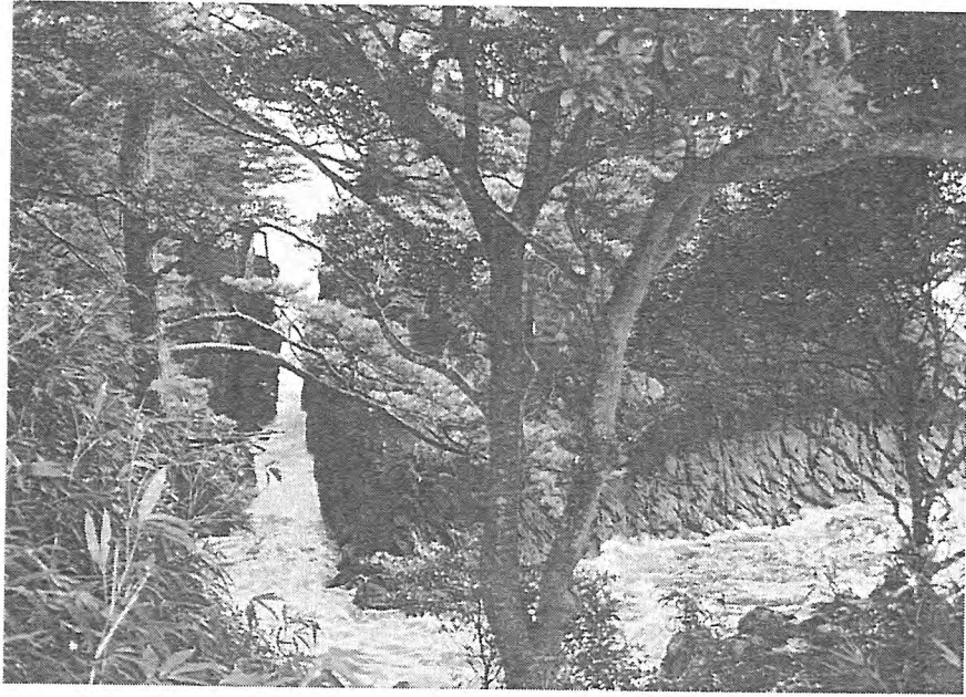
写-3 神割崎の美しい景観