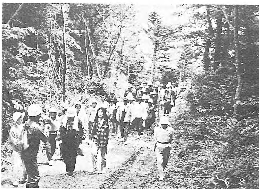
写-12 森林(もり)を散策する参加者