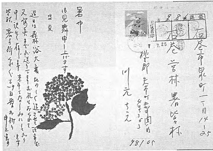
写-17 参加者からのお礼のはがき