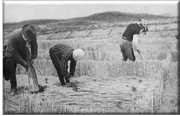
植付後のワラ敷作業