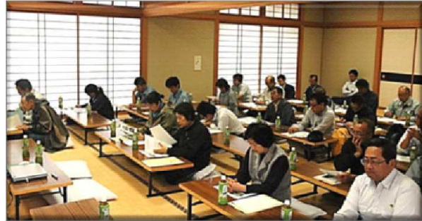
研修会（座学）のようす