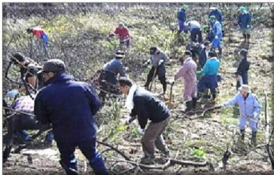
火事跡地の整理の様子

山火事跡地におけるボランティア等による植樹、森林官、森林ボランティア等による山火事パトロールの実施、地元自治体や森林ボランティア等と連携しての、不法投棄されたゴミや漂着物の清掃活動、屏風山海岸防災林の歴史や、重要性をPRする看板の設置、マツクイムシ被害が、青森県深浦町の広戸・追良瀬地区まで北上してきていることから、森林監視活動の強化などしてきましたが、地域住民の屏風山の森林に対する理解を深めるため、新たな活動として、地域住民が参加しての現地研修会を開催することとしました。