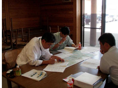
写真3 雄勝地域振興局管内計画作成作業部会

10月に開催した第2回全体研修会では、たたき台について意見交換を行い、この段階で素案として仕上げ、市町村長への報告、地域住民等への説明会の開催に進めた。