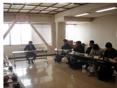
写真1 研修会 5市2町から10名が出席