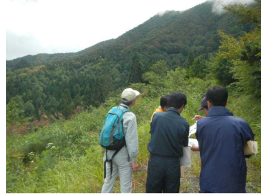
写真4 「植栽によらなければ適確な更新が困難な森林」の現地確認（横手市）