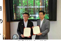
覚書締結の様子 左 佐竹秋田県知事 右 飛山東北森林管理局長