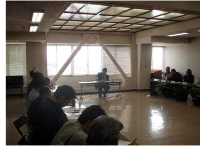
写真2 意見交換会 市町のほか、森林組合、製材協同組合など、8団体から9名が出席

「③上記を改善するために、それぞれ（川上側・川下側）が必要なことは何であると考えているか」では、「川上側・川下側が一体となった森林資源循環利用システムの構築」が出され、川上から川下間のコーディネートの必要性がうかがえた。