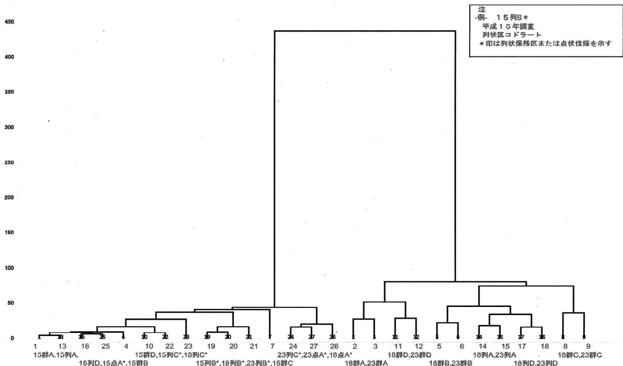
図-2. 植生被度クラスター解析樹系図

図-2 では、列状伐採区及び群状伐採区のグループと、伐採前、列状保残区並びに点状伐採区で植生の状況が大きく分かれた。群状伐採区のうち列状伐採区に比較的似た植生になるもの（群 B,C）と、比較的異なるもの（群 A,D）に分かれた。一方で列状保残区及び点状伐採区の植生は、伐採実施前の植生とあまり変化はみられなかった。