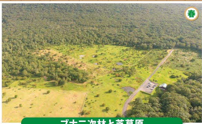
ブナ二次林と芝草原