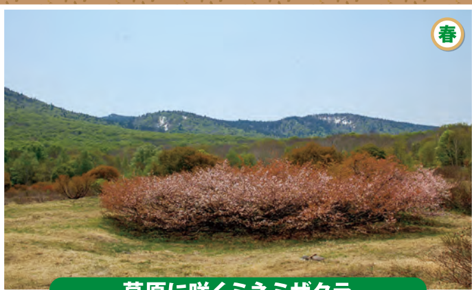
草原に咲くミネミザクラ