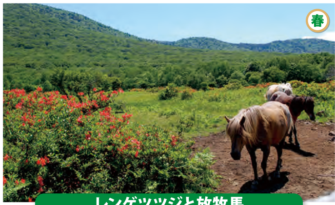
レンゲツツジと放牧馬