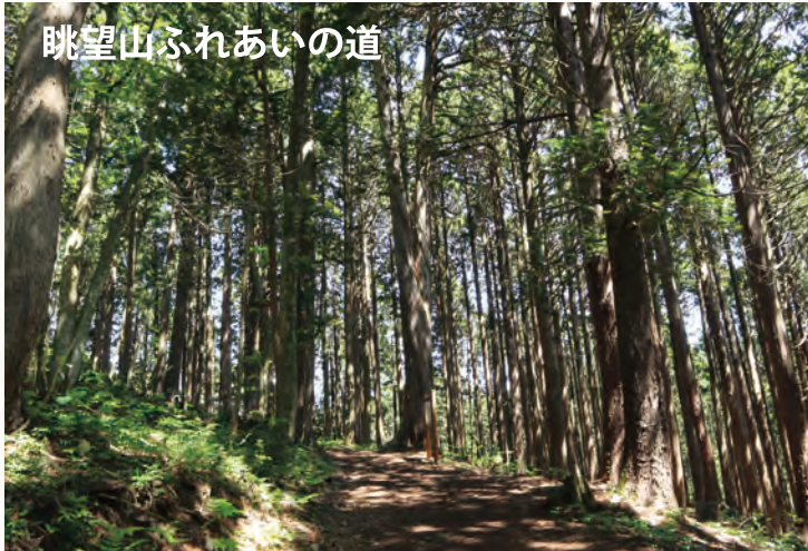
眺望山ふれあいの道