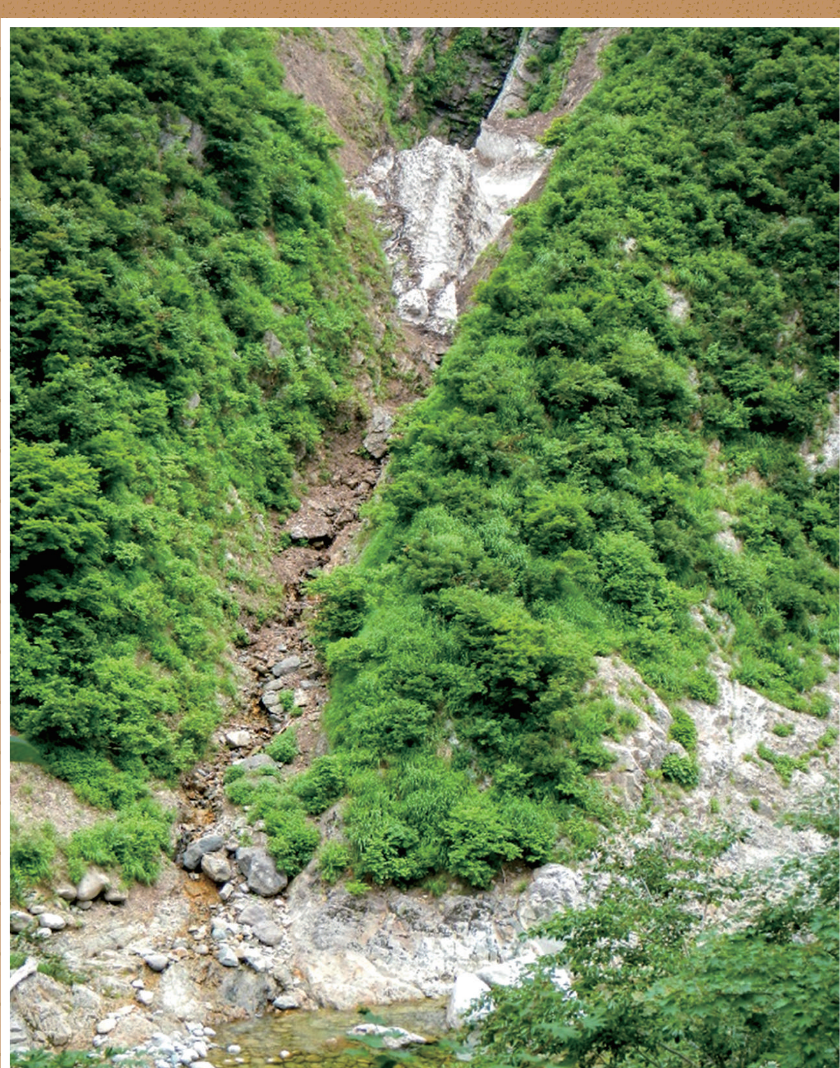
けもの歩道から見えるカモシカ沢の残雪