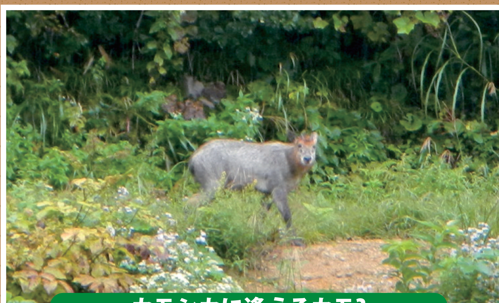
カモシカに逢えるカモ?