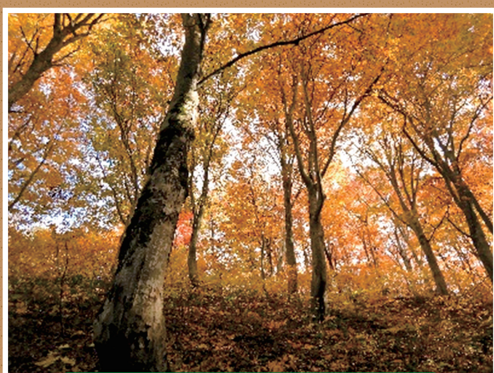
参道途中に広がるブナ林