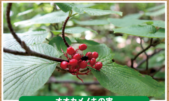
オオカメノキの実