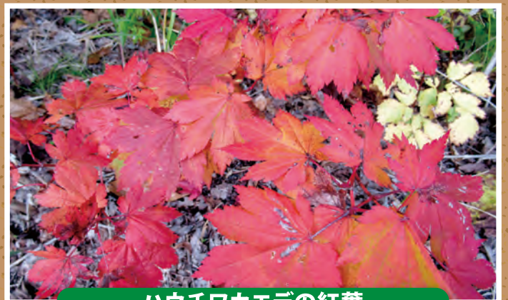
ハウチワカエデの紅葉