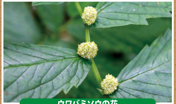
ウワバミソウの花