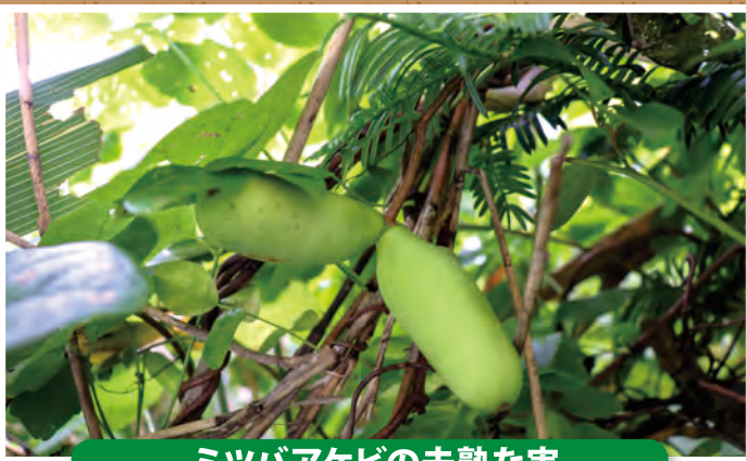
ミツバアケビの未熟な実