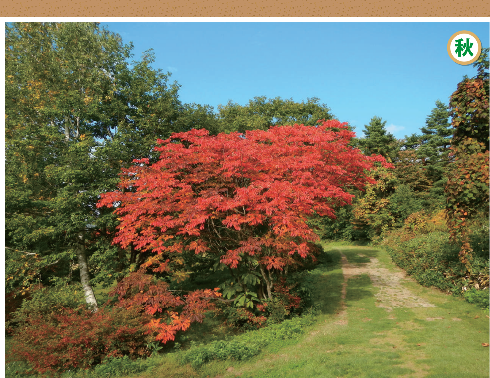
蔵王高原坊平のヤマウルシ