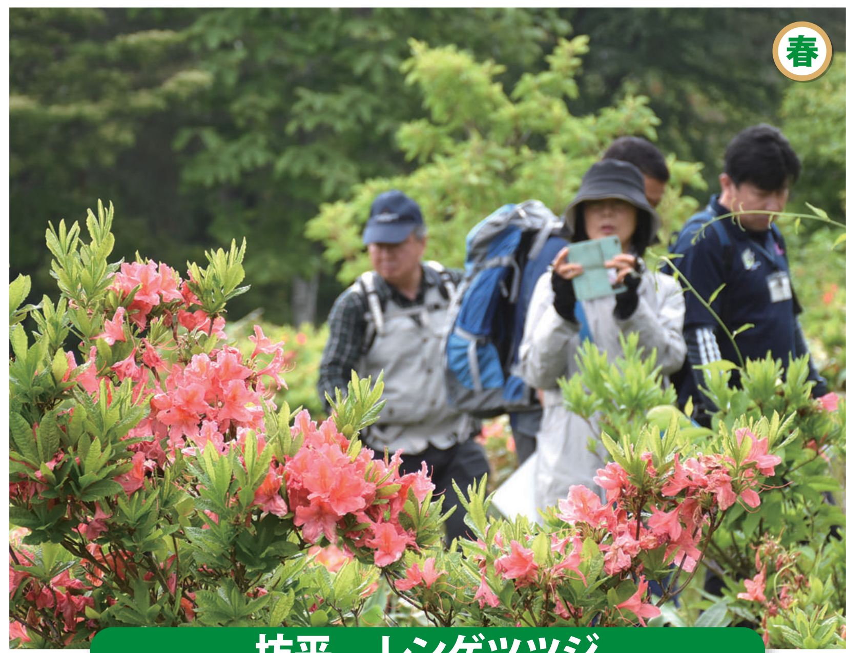
坊平 レンゲツツジ