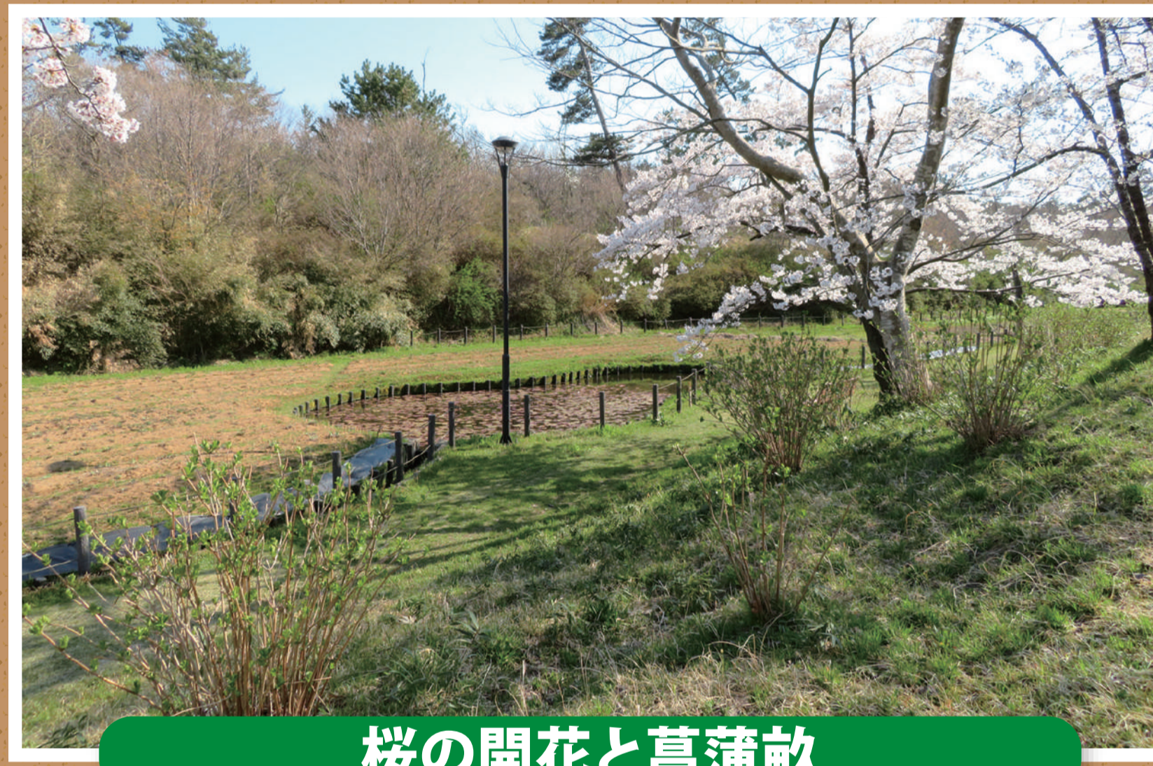
桜の開花と菖蒲畝