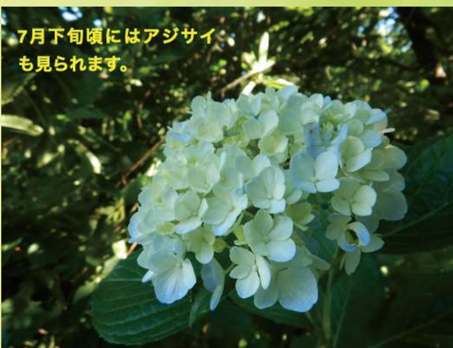
7月下旬頃にはアジサイも見られます。