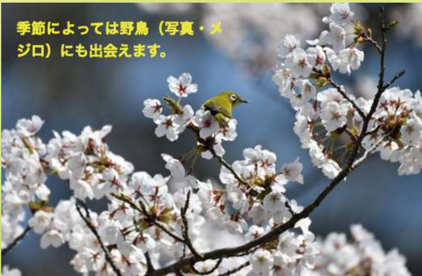
季節によっては野鳥(写真・メジロ)にも出会えます。