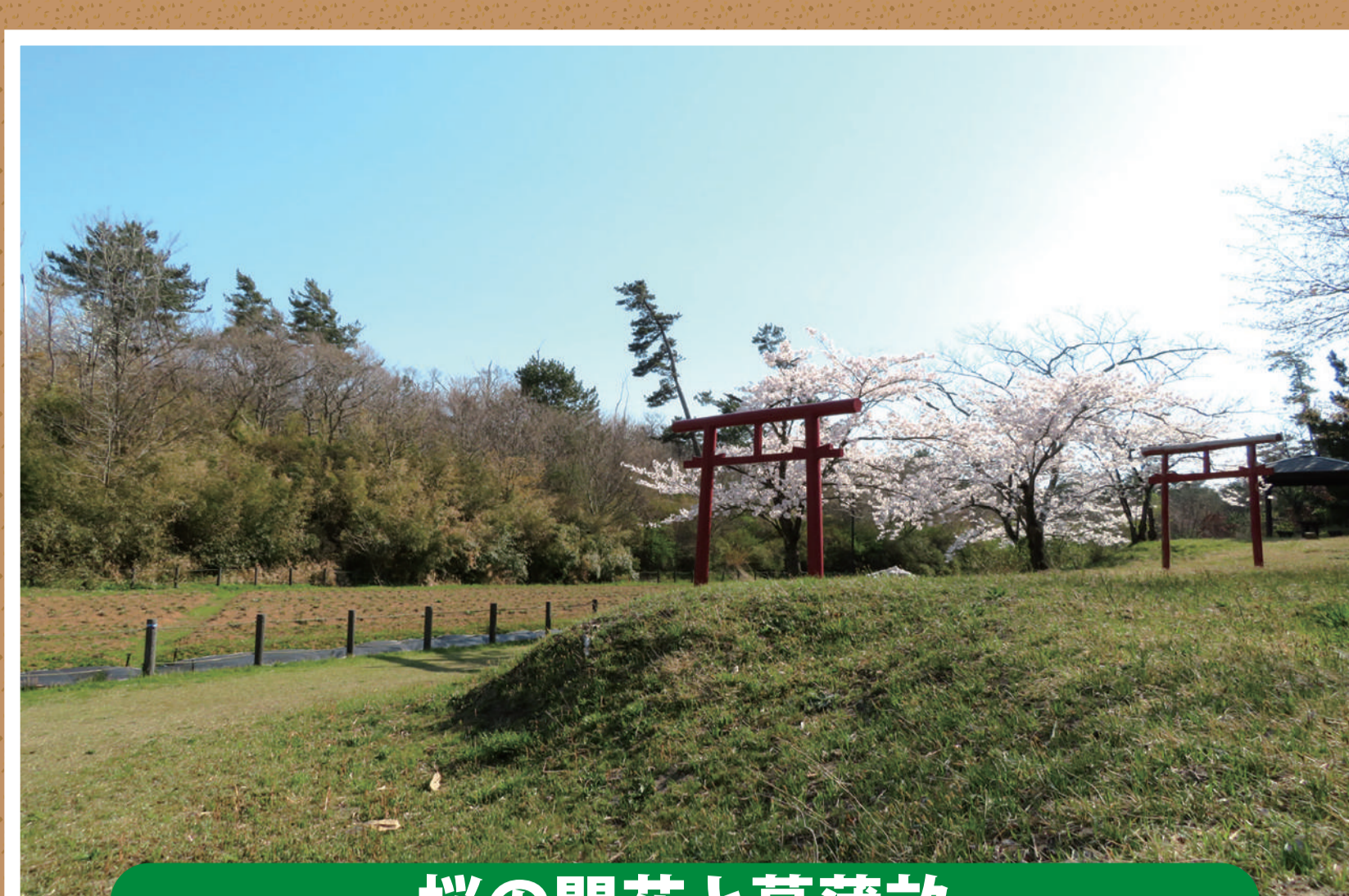
桜の開花と菖蒲畝