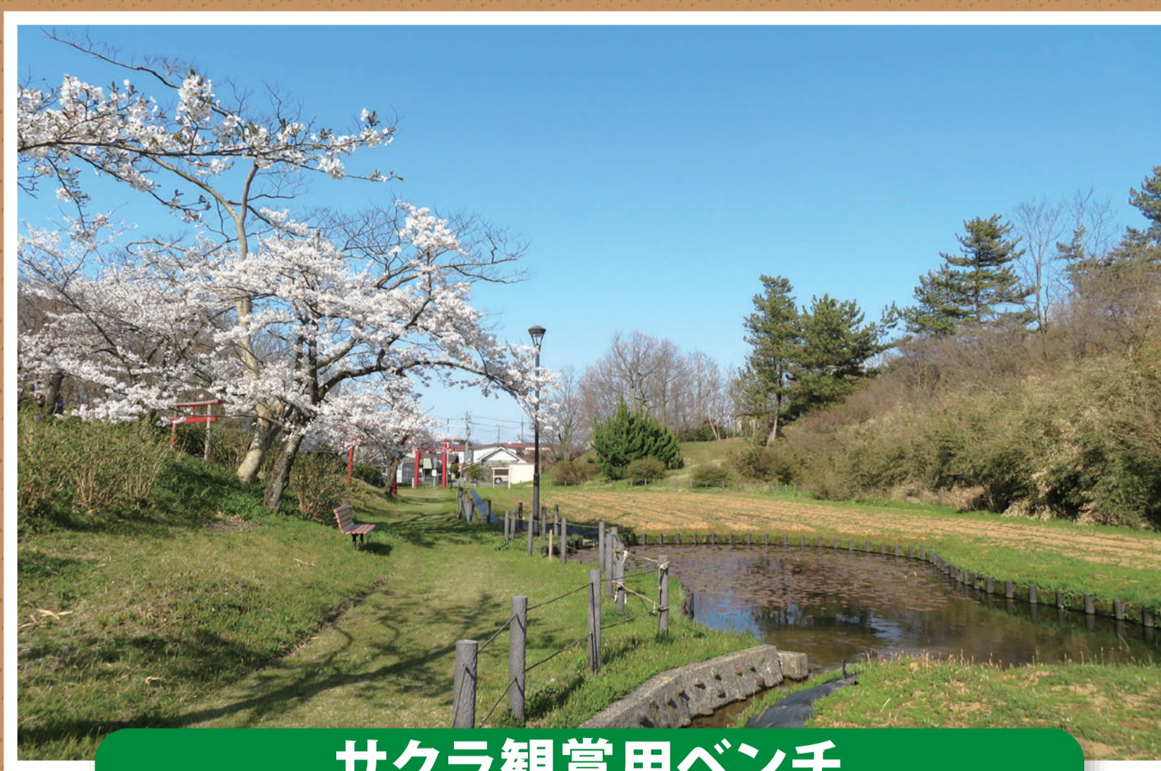
サクラ観賞用ベンチ