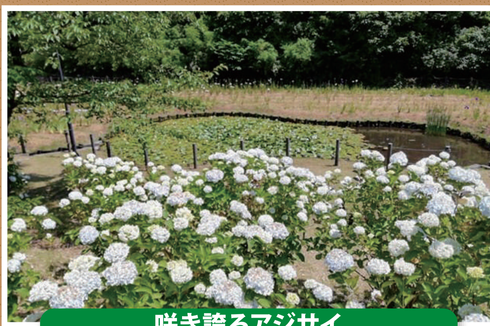
咲き誇るアジサイ