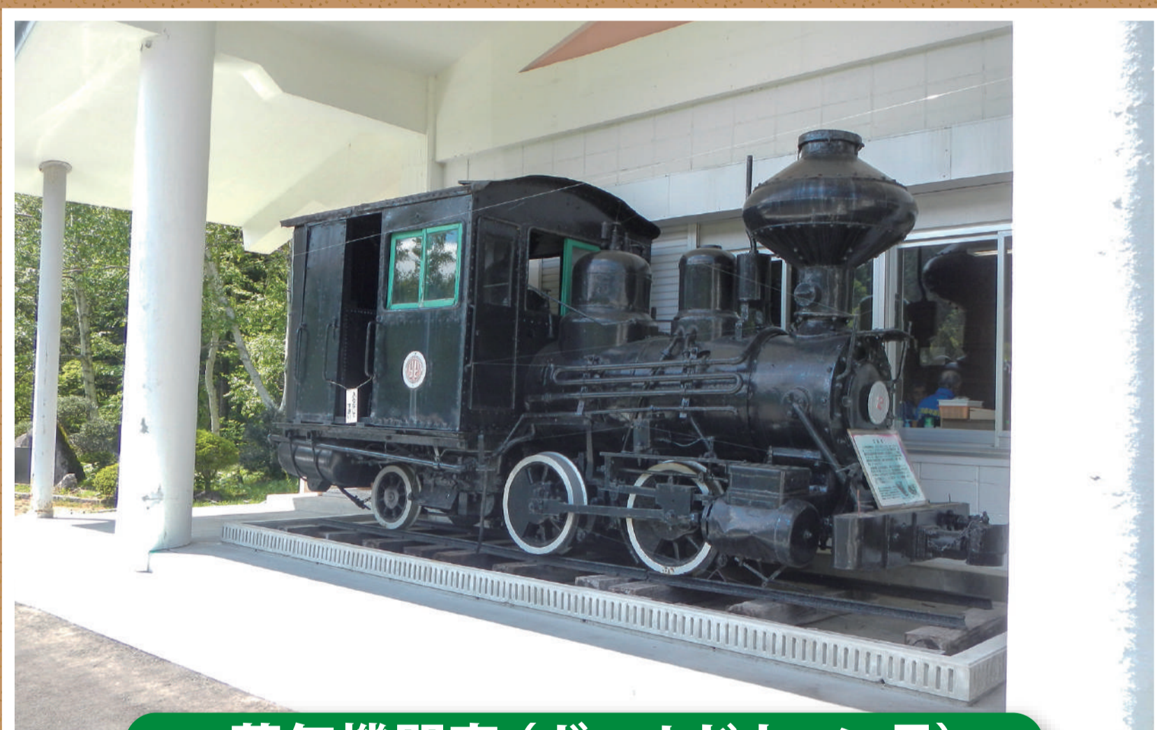
蒸気機関車（ボールドウィン号）

※令和5年度の開館日程については、開館日が決まり次第、更新いたします。 詳しくは、東北森林管理局秋田森林管理署又は、仁別森林博物館にお問合せ下さい。 (参考：令和4年度の開館期間は、6月18日～10月30日の土・日・月曜日で企画展開催等の日程により一部開館日は異なっております。)