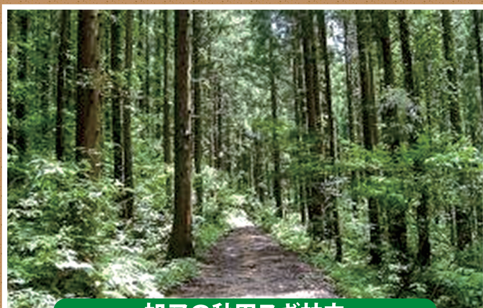
旭又の秋田スギ林内