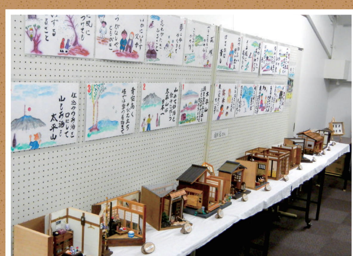
仁別の森林の案内人会展

※令和5年度の開館日程については、開館日が決まり次第、更新いたします。 詳しくは、東北森林管理局秋田森林管理署又は、仁別森林博物館にお問合せ下さい。 (参考：令和4年度の開館期間は、6月18日～10月30日の土・日・月曜日で企画展開催等の日程により一部開館日は異なっております。)