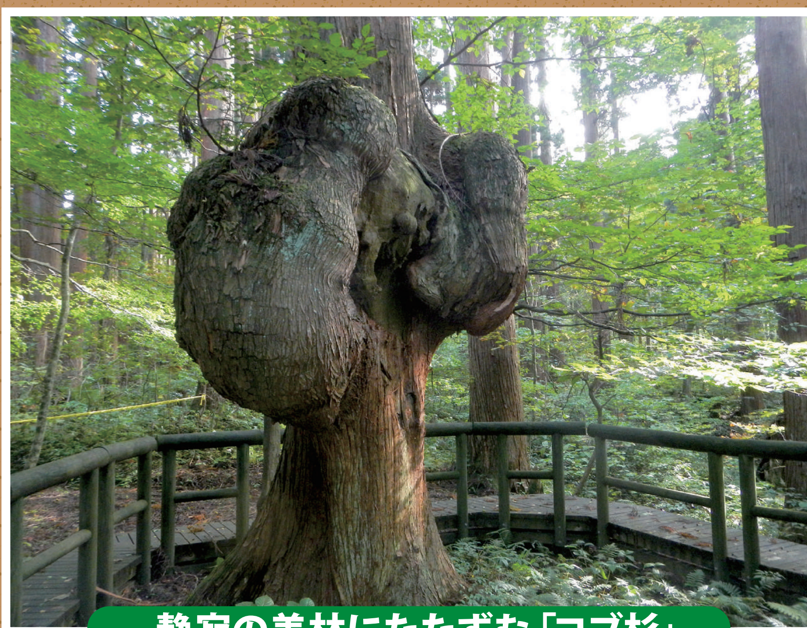
静寂の美林にたたずむ「コブ杉」