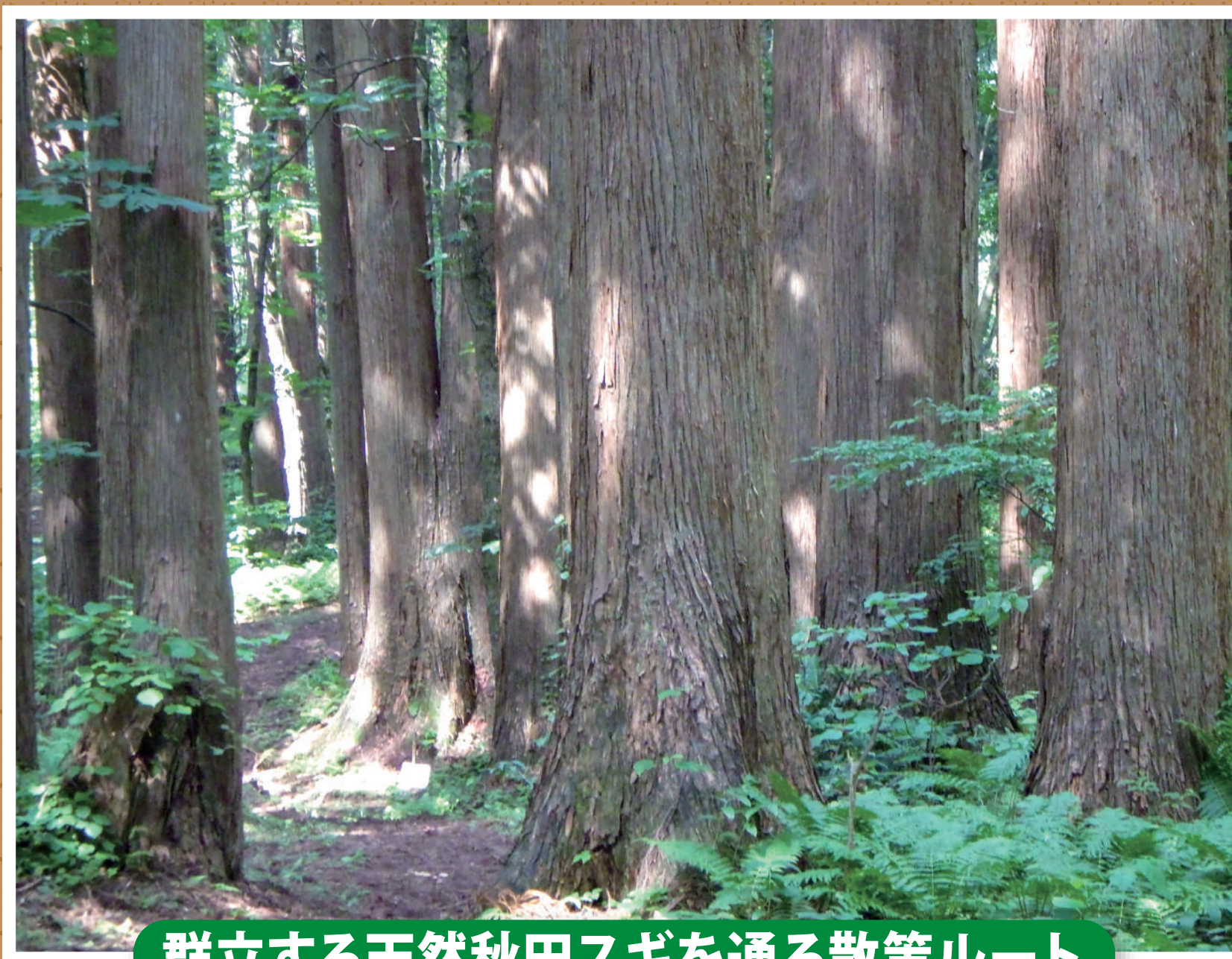
群立する天然秋田スギを通る散策ルート