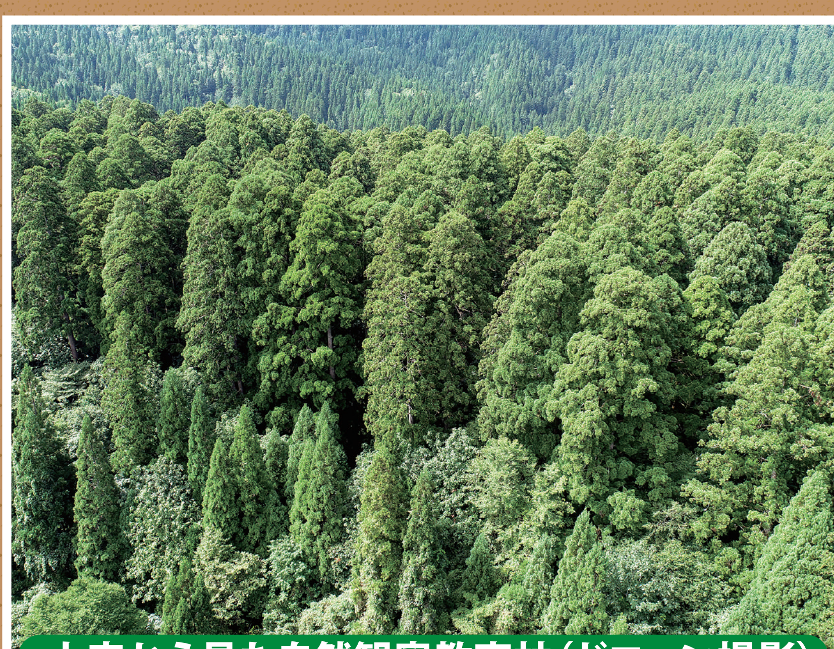
上空から見た自然観察教育林(ドローン撮影)