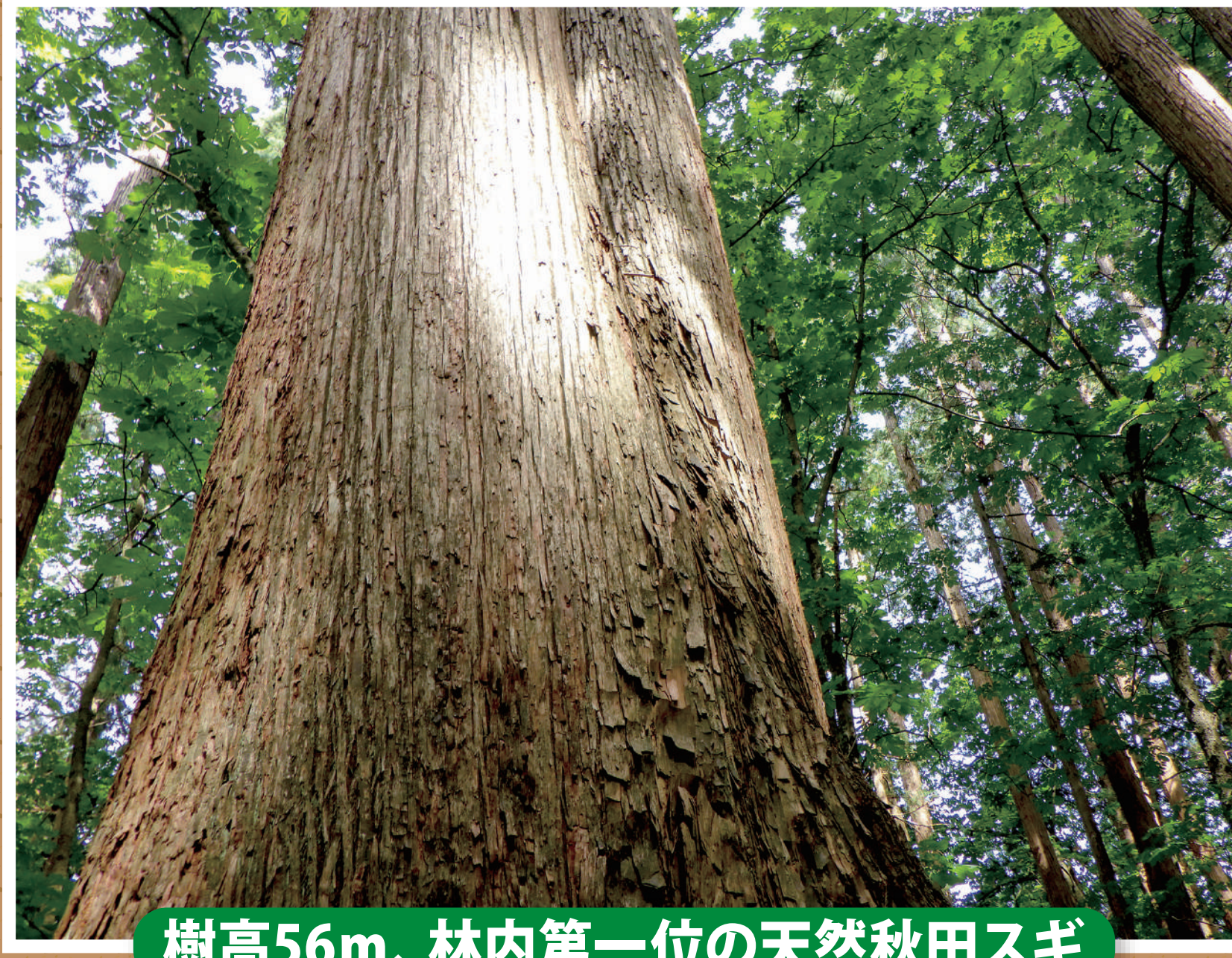
樹高56m、林内第一位の天然秋田スギ