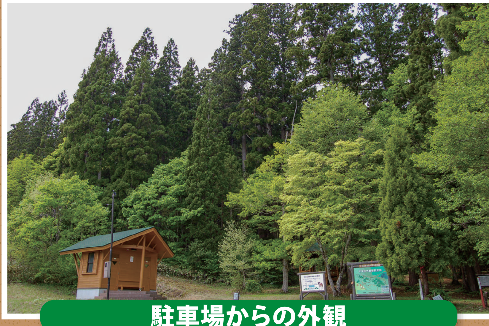
駐車場からの外観