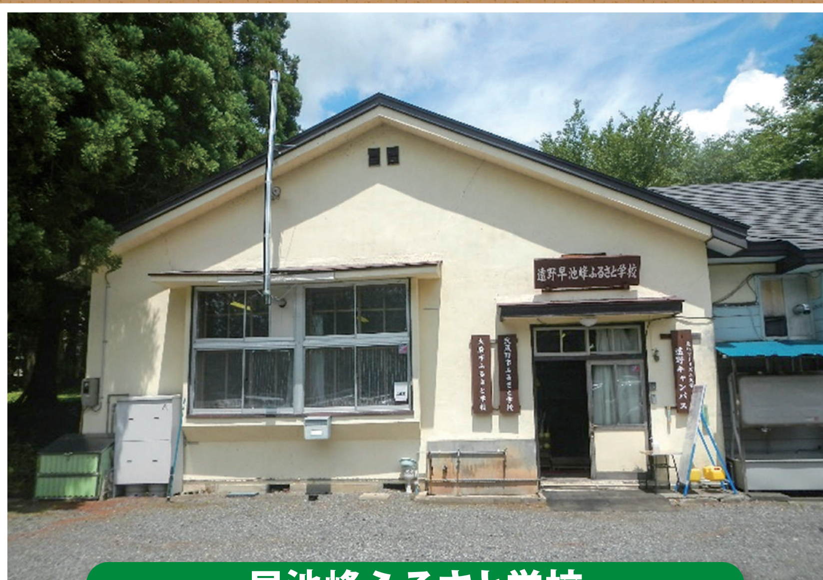
早池峰ふるさと学校