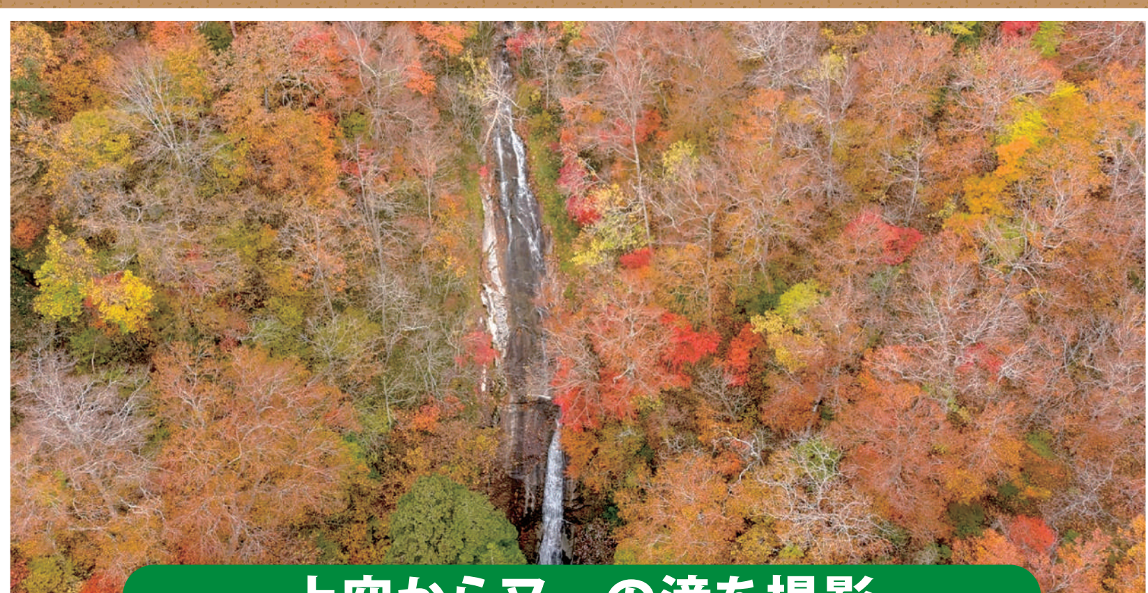
上空から又一の滝を撮影