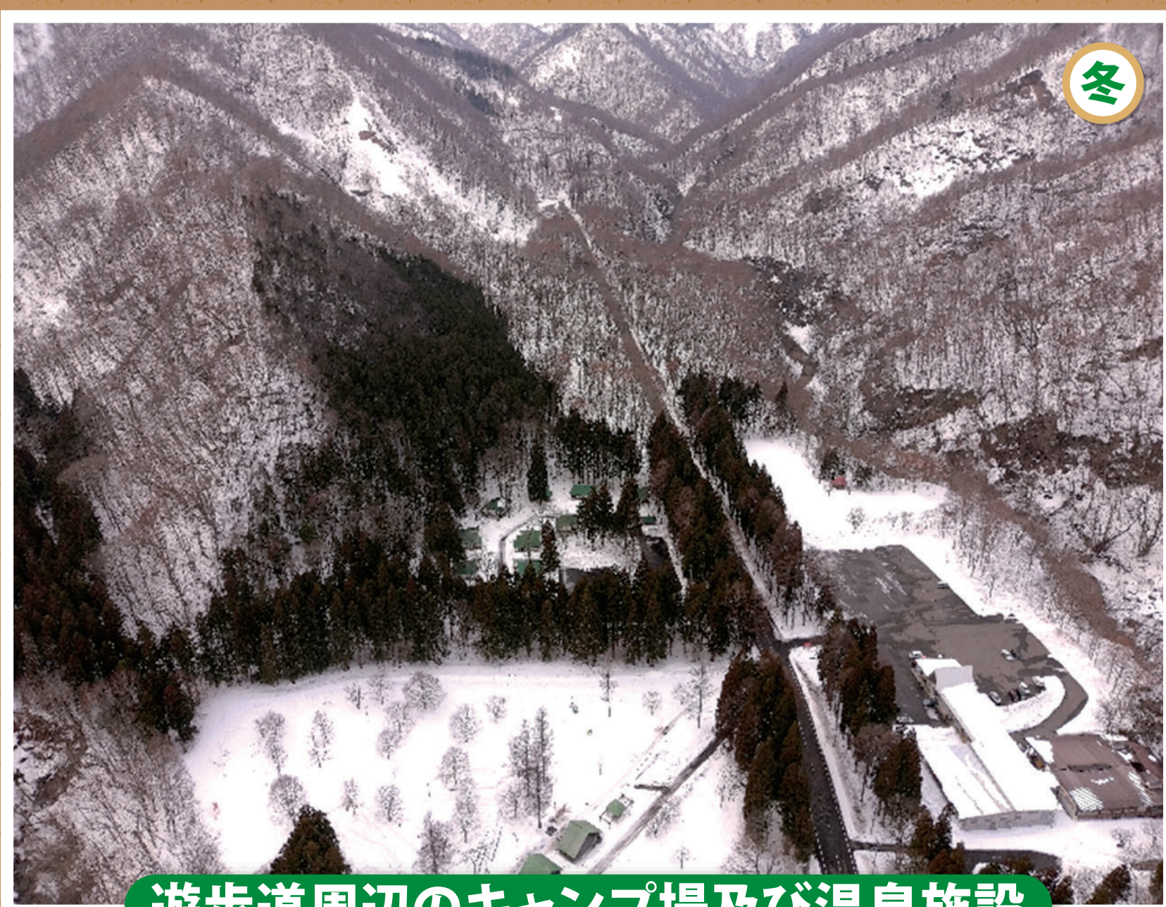
遊歩道周辺のキャンプ場及び温泉施設