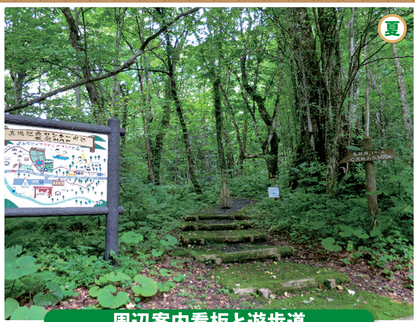
周辺案内看板と遊歩道