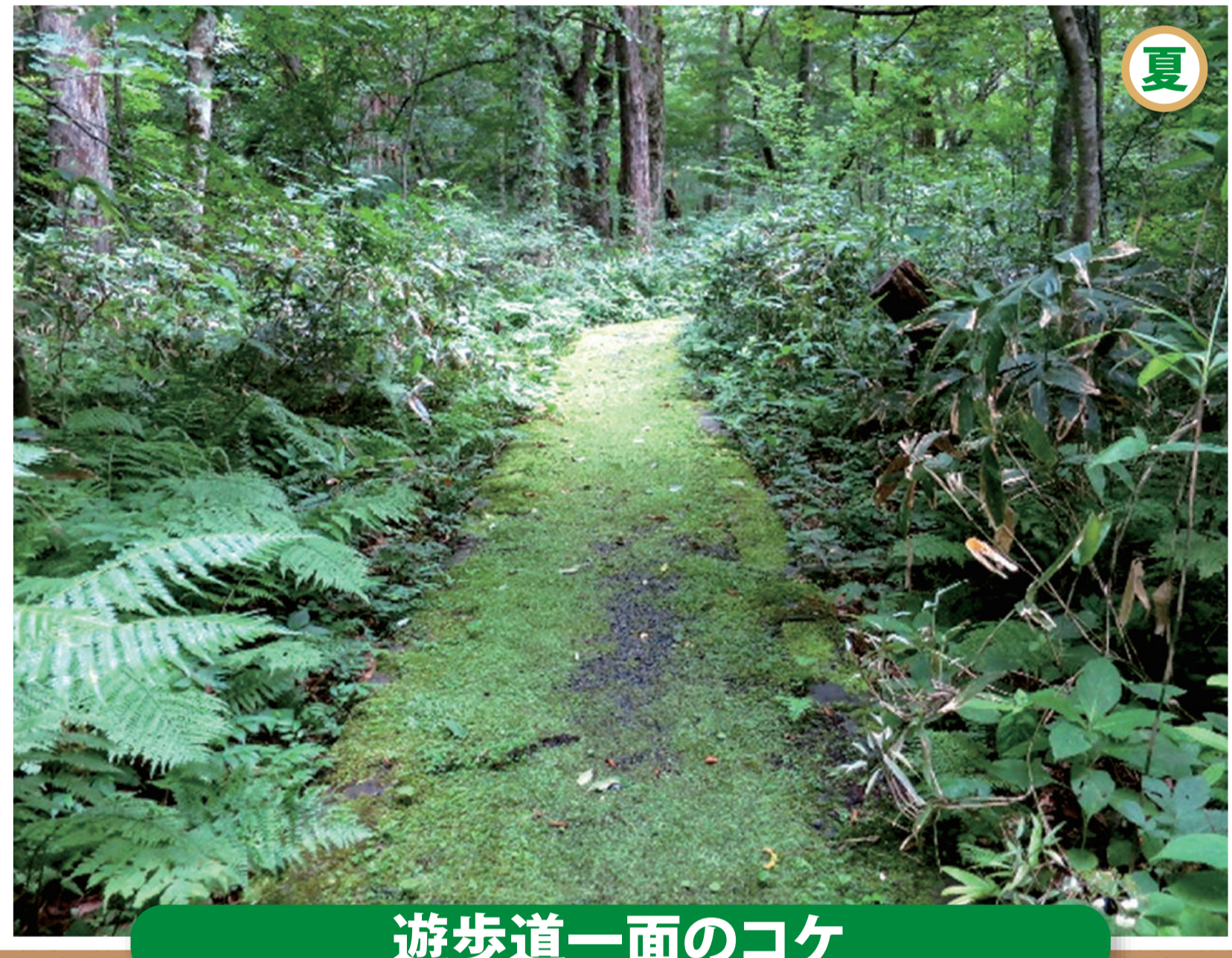
遊歩道一面のコケ