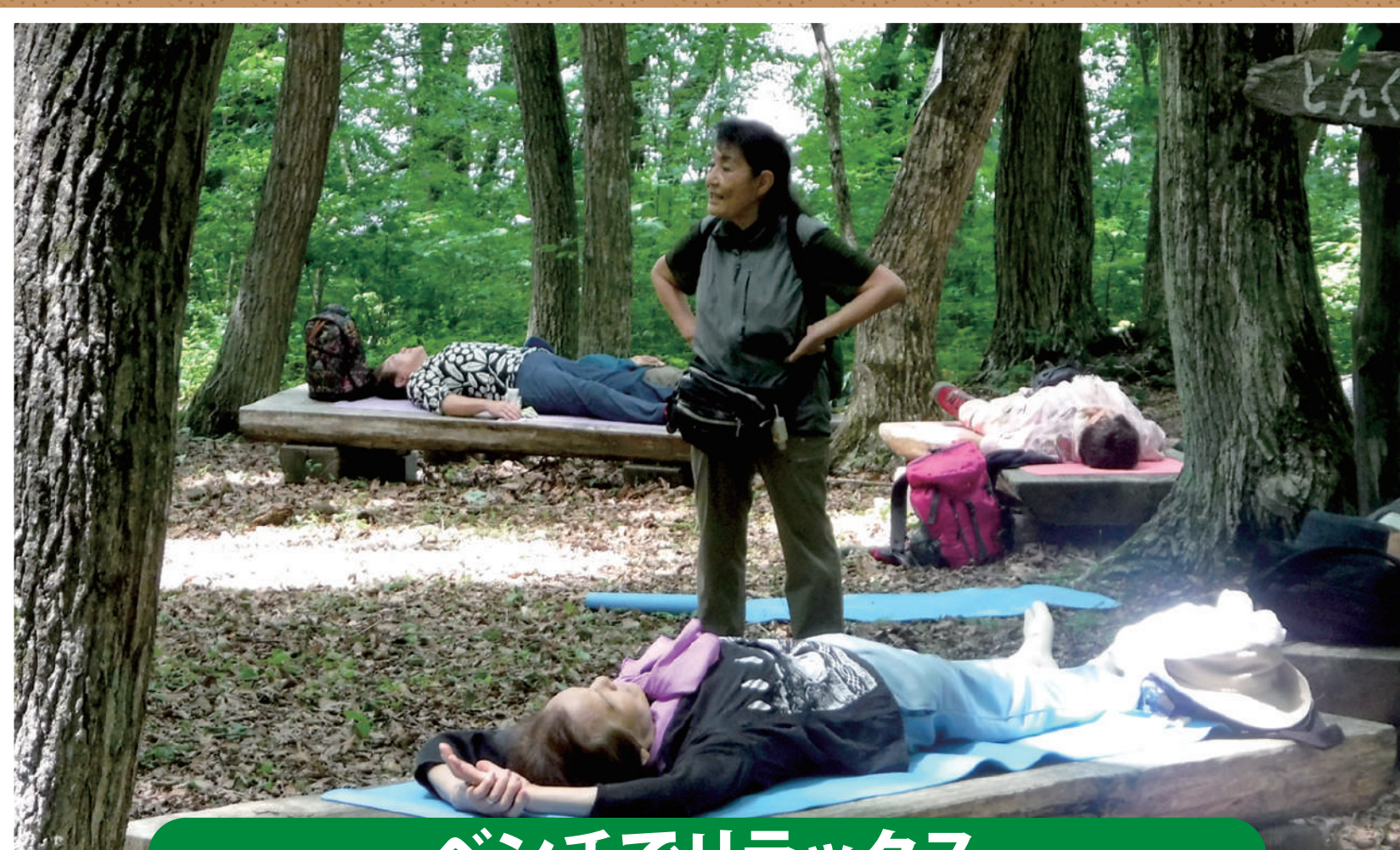
ベンチでリラックス