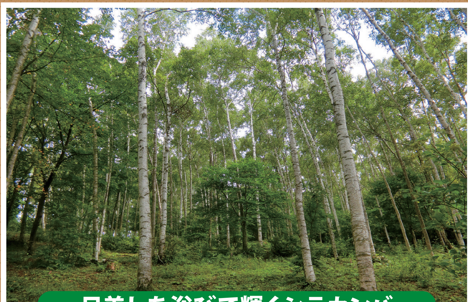
日差しを浴びて輝くシラカンバ