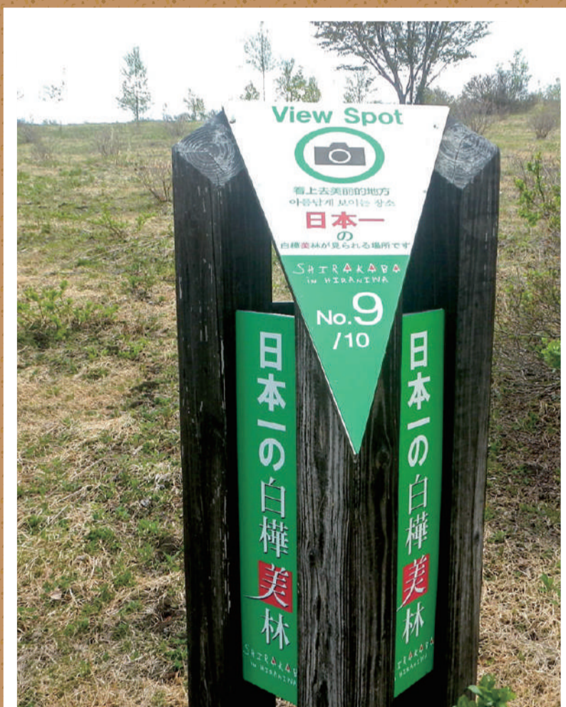
「映える」スポットあります!