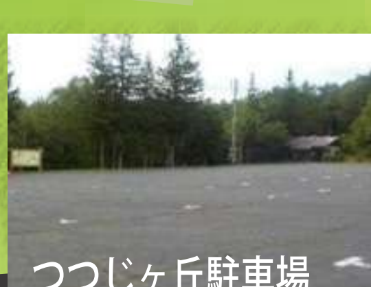
つつじヶ丘駐車場