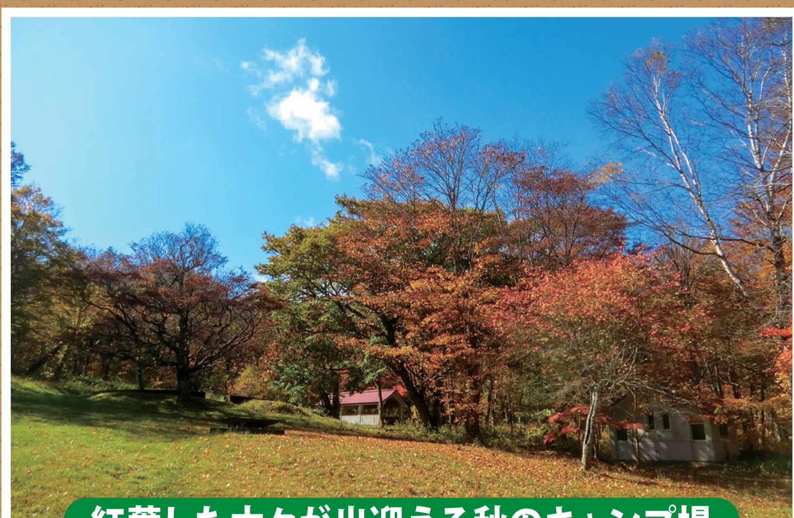
紅葉した木々が出迎える秋のキャンプ場