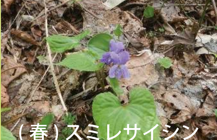
(春)スミレサイシン