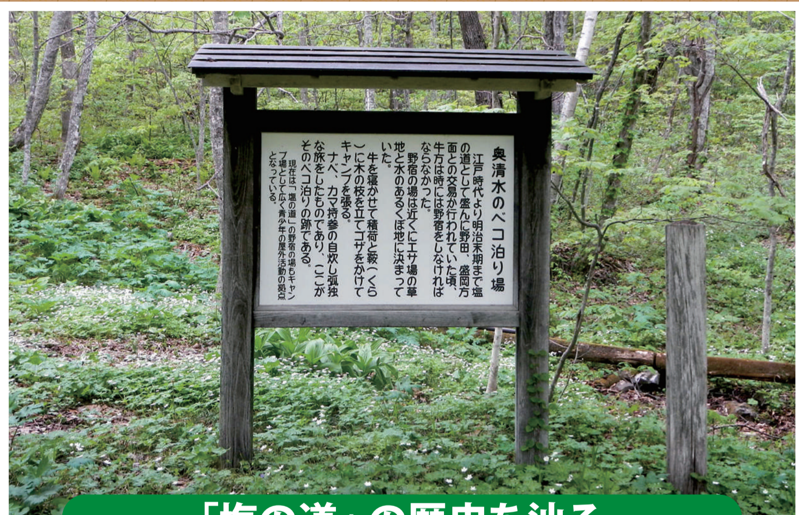
「塩の道」の歴史を辿る