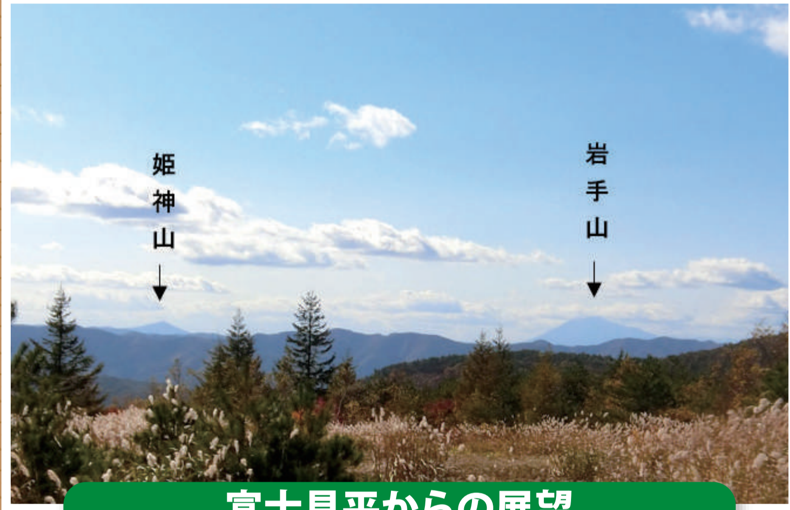
富士見平からの展望