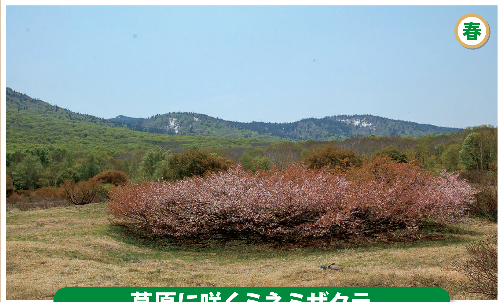
草原に咲くミネミザクラ