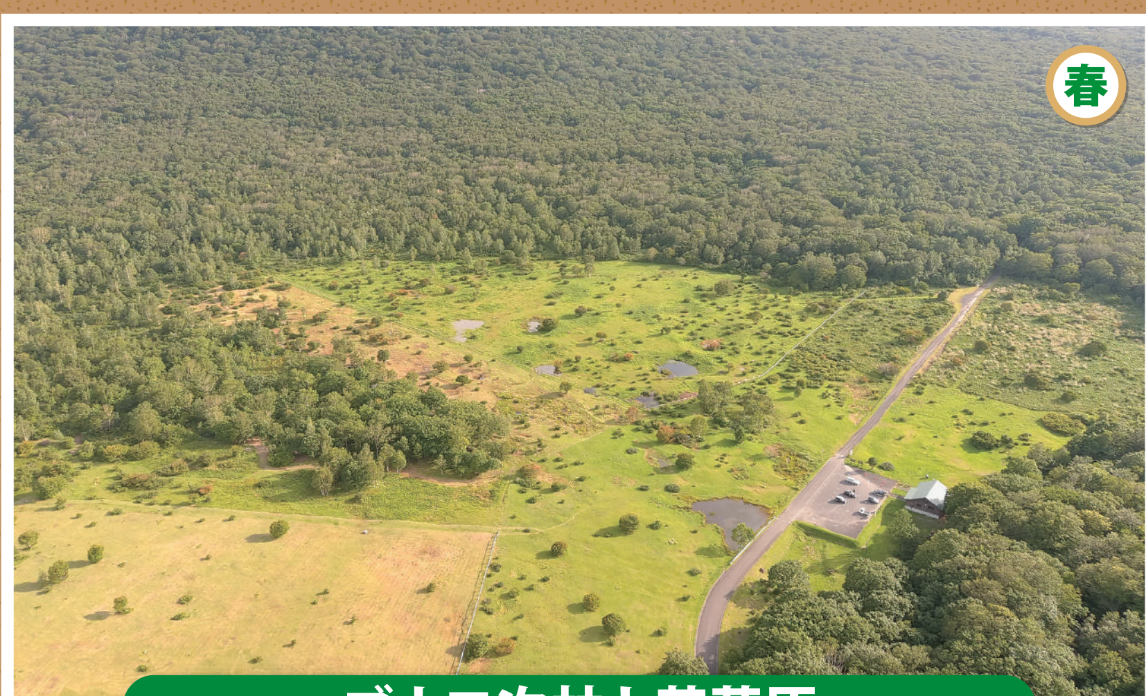
ブナ二次林と芝草原