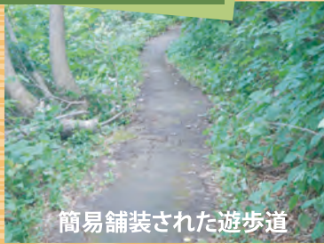
簡易舗装された遊歩道