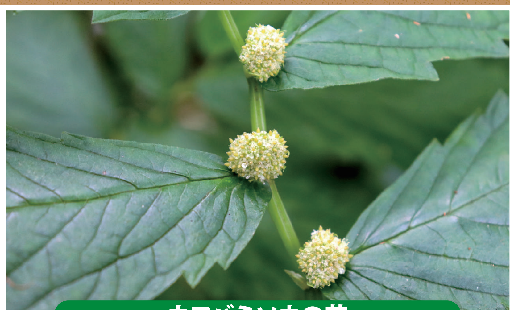
ウワバミソウの花