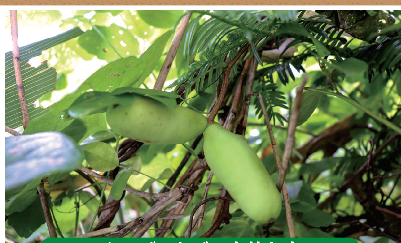
ミツバアケビの未熟な実