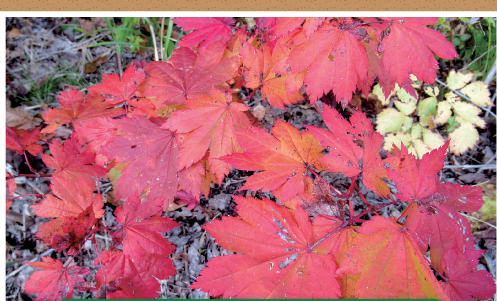
ハウチワカエデの紅葉