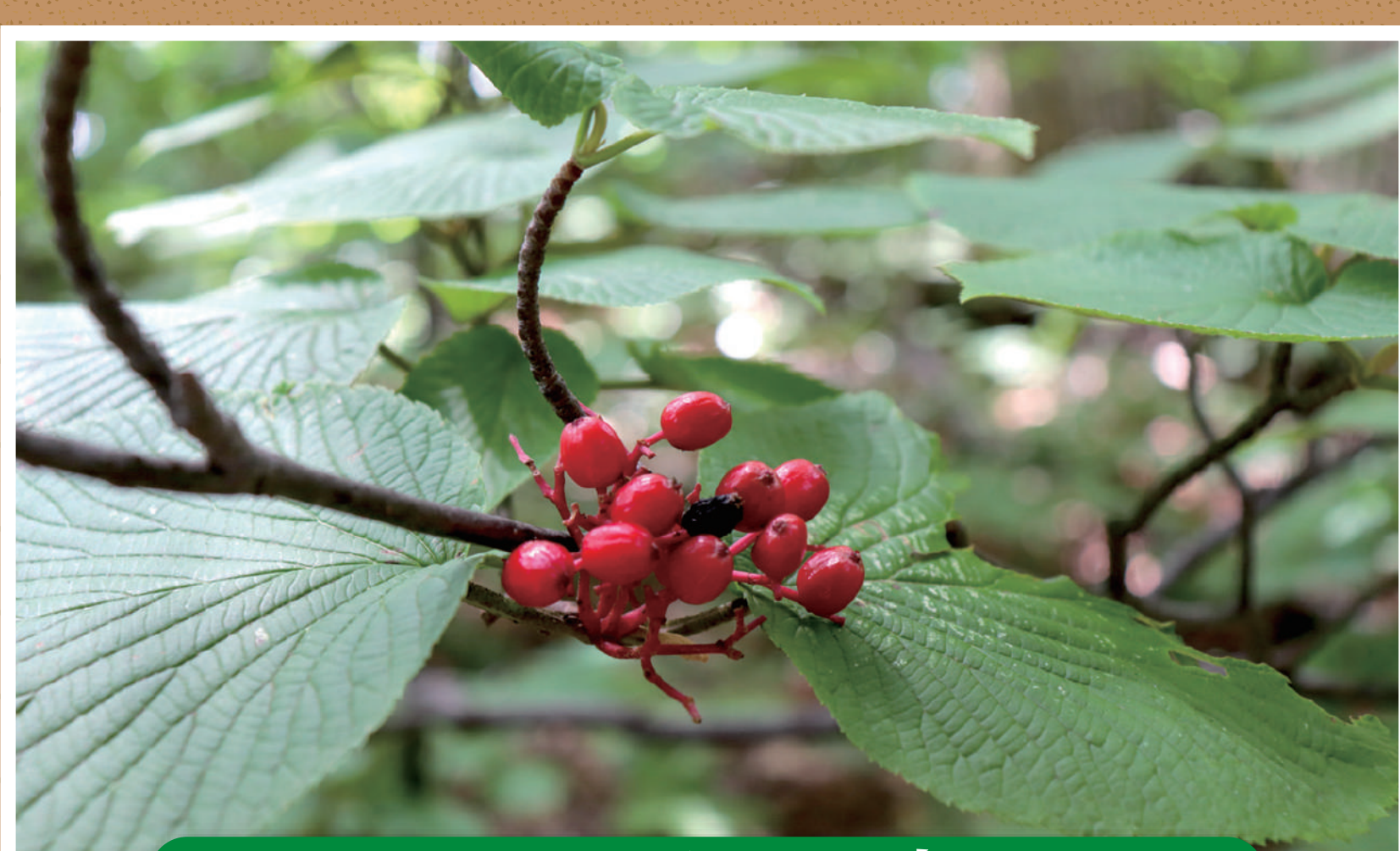
オオカメノキの実