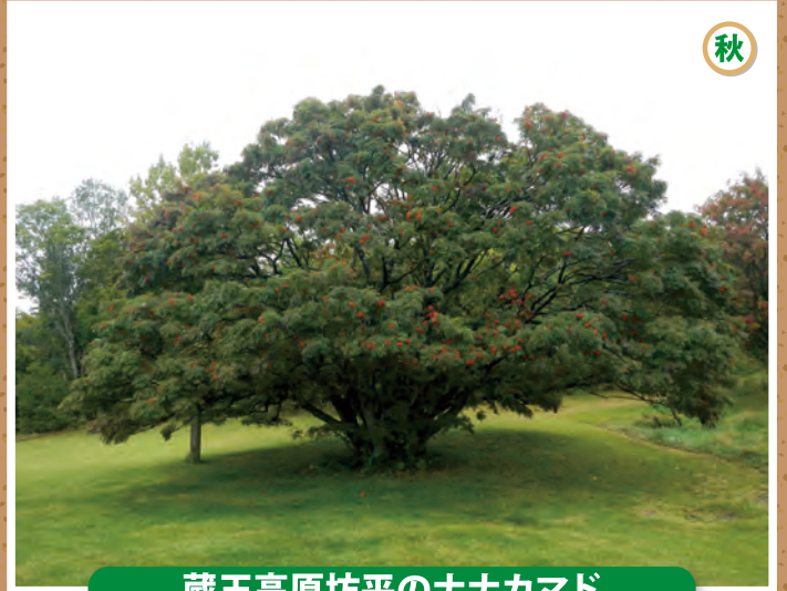
蔵王高原坊平のナナカマド