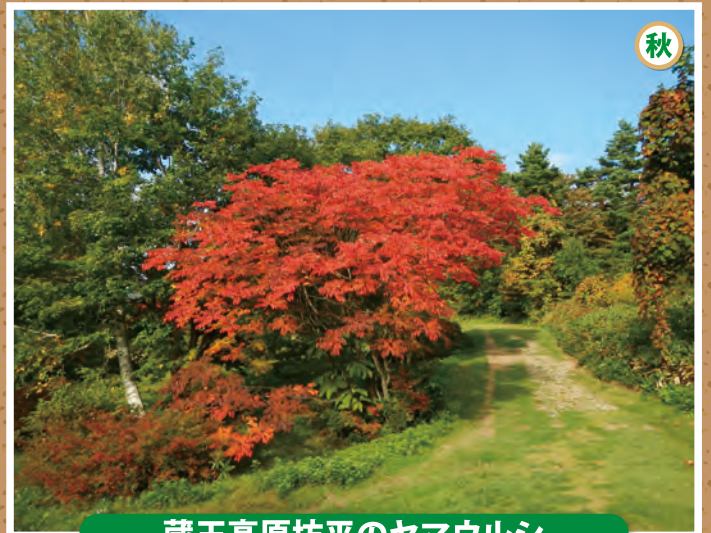
蔵王高原坊平のヤマウルシ