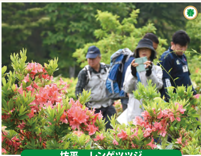
坊平 レンゲツツジ