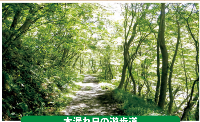
木漏れ日の遊歩道