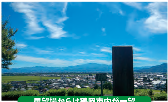
展望場からは鶴岡市内が一望