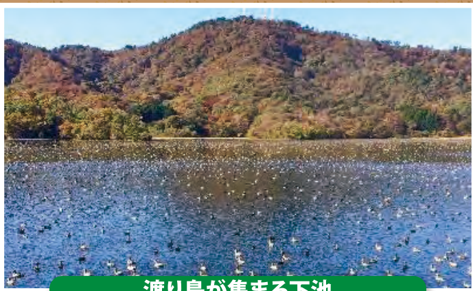
渡り鳥が集まる下池