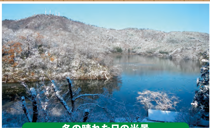
冬の晴れた日の光景