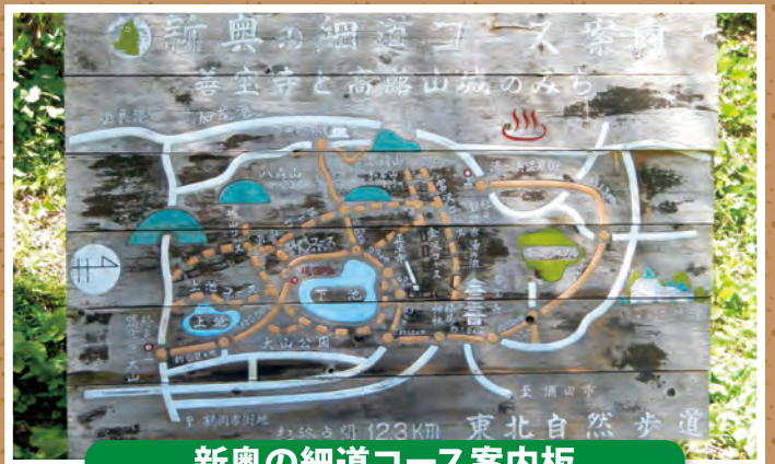
新奥の細道コース案内板