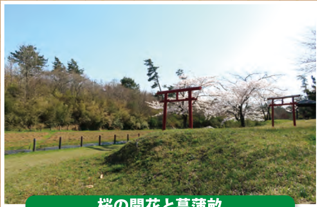
桜の開花と菖蒲畝