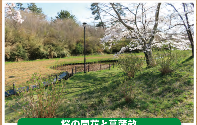
桜の開花と菖蒲畝