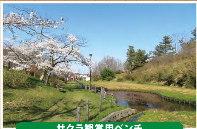
サクラ観賞用ベンチ