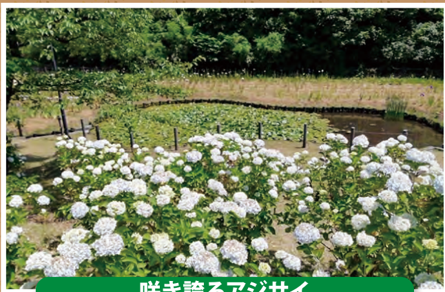
咲き誇るアジサイ