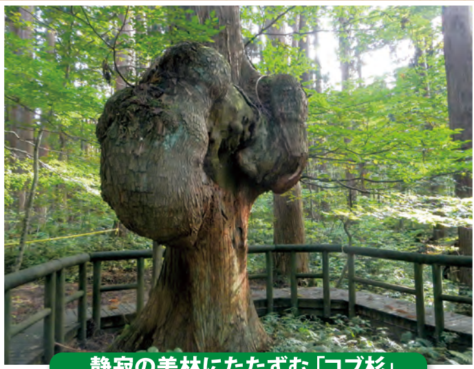
静寂の美林にたたずむ「コブ杉」