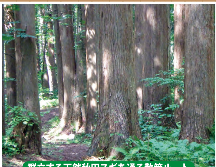
群立する天然秋田スギを通る散策ルート