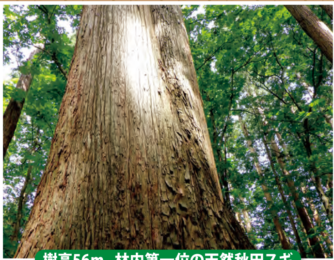
樹高56m、林内第一位の天然秋田スギ