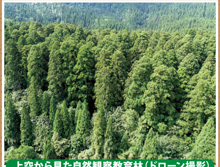
上空から見た自然観察教育林(ドローン撮影)