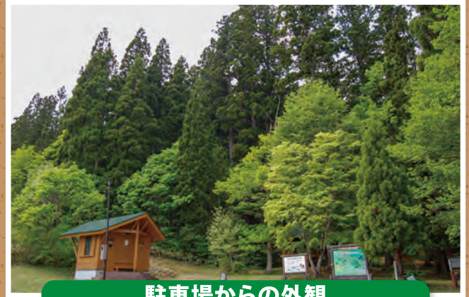
駐車場からの外観