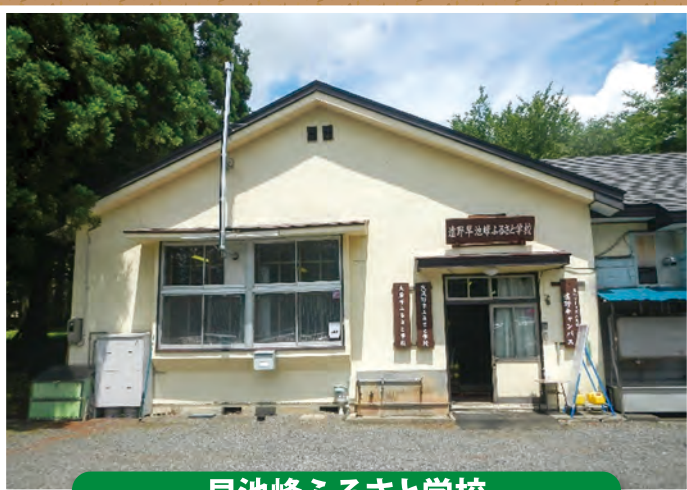
早池峰ふるさと学校