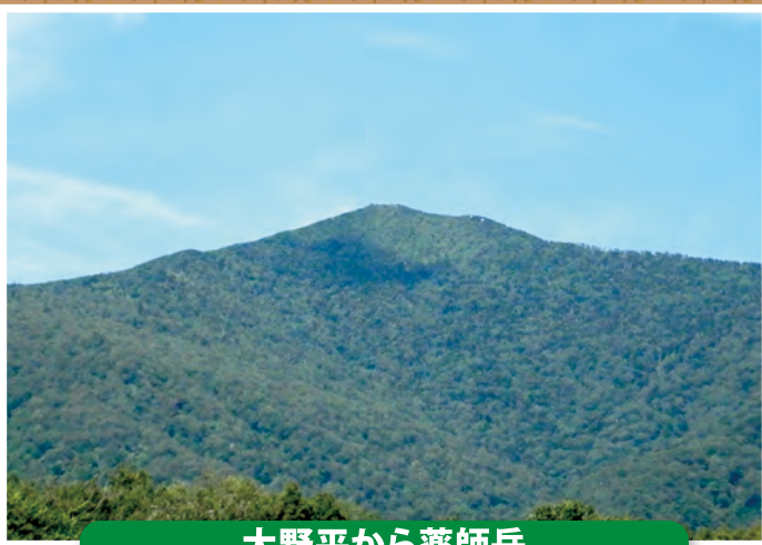
大野平から薬師岳