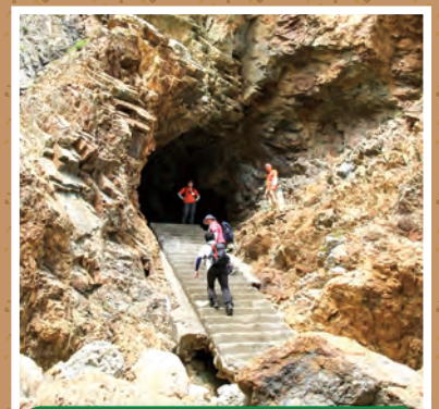
北山崎の海蝕洞窟