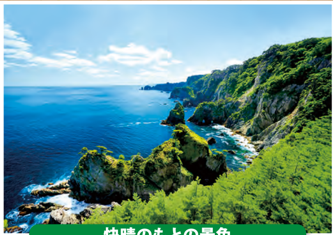
快晴のもとの景色