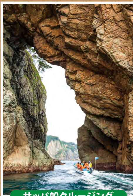
サップ船クルージング