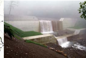
産女川【溪間工(谷止工)】