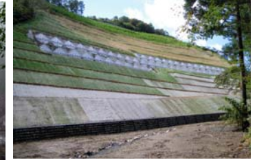
ニゴリ沢第二工区【地すべり防止工事】