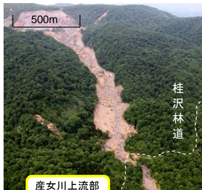
産女川上流部崩壊地