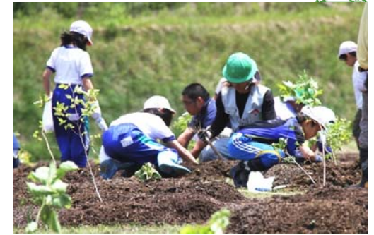
小学生による植樹の様子