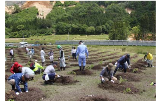
市野々原地区住民による植樹の様子