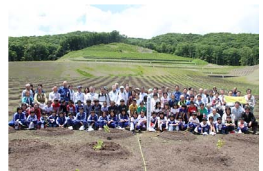
植樹記念標柱とともに

市野々原地区の災害復旧地において、地震から3年となった平成23年6月14日に地元小学校、地域住民および多くの一関市民にご参加いただき植樹祭を行いました。