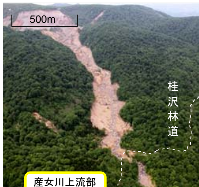
産女川上流部崩壊地